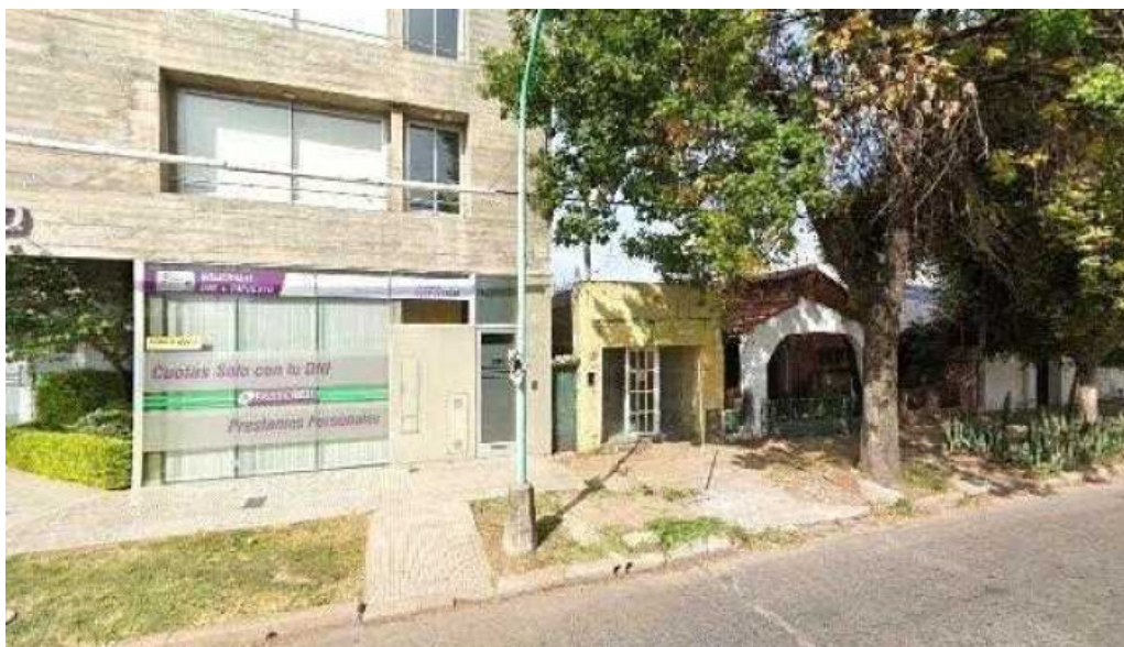
Fast cred donde