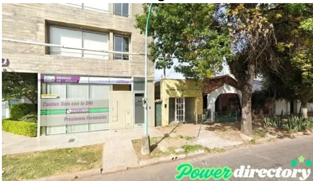
Fast cred santo tome