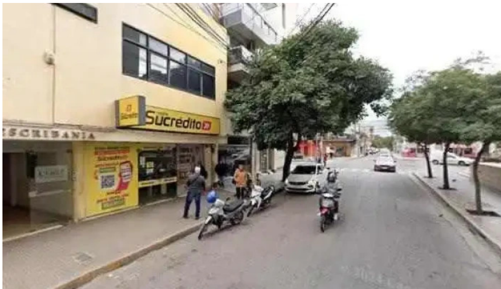
Tarjeta sucredito direcciondeg