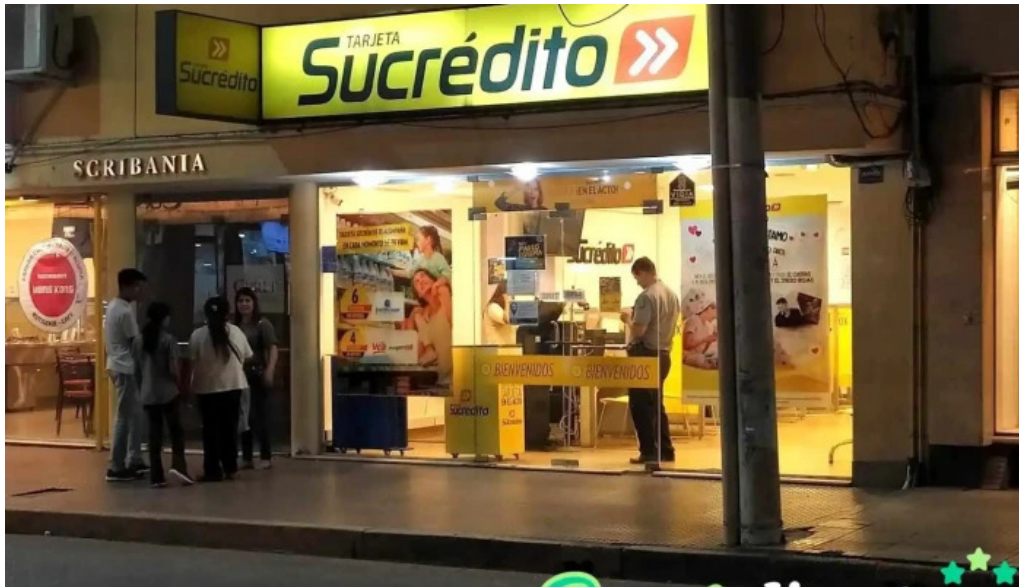
Tarjeta sucredito santiago del estero