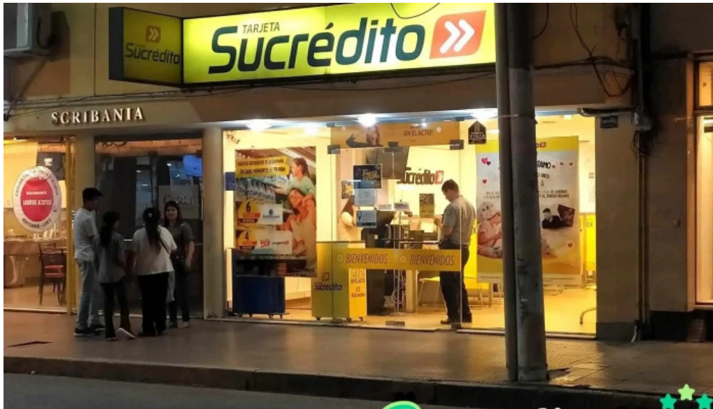
Tarjeta sucredito direccion