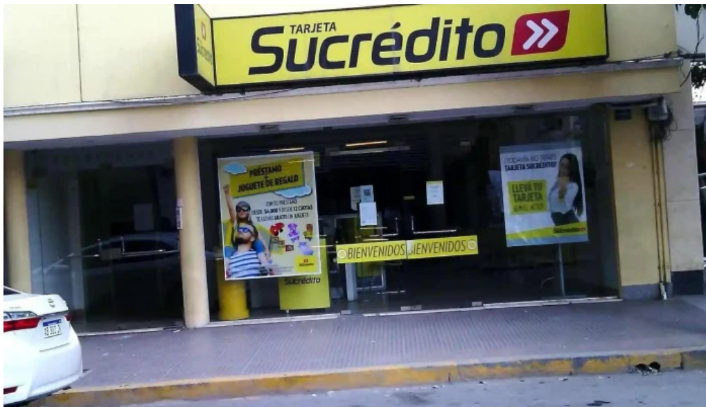
Tarjeta sucredito exterior