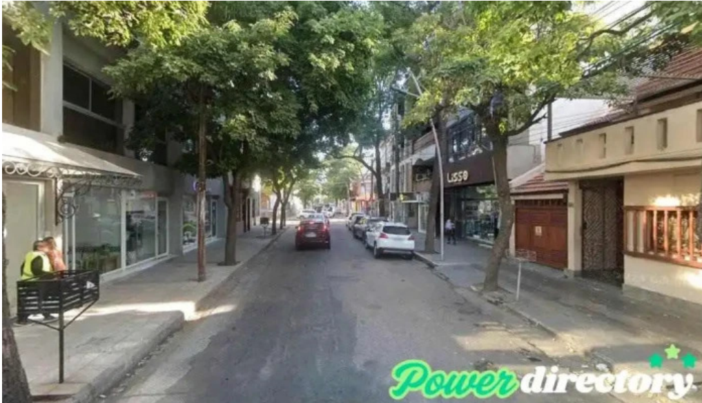
Finan pyme sgo santiago del estero