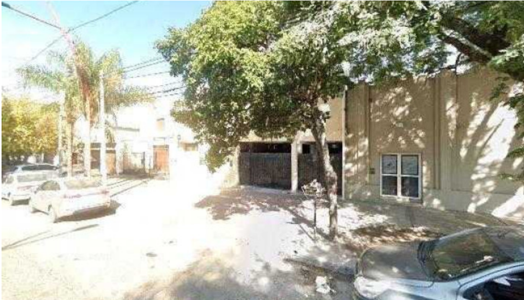
Estero credits promocion