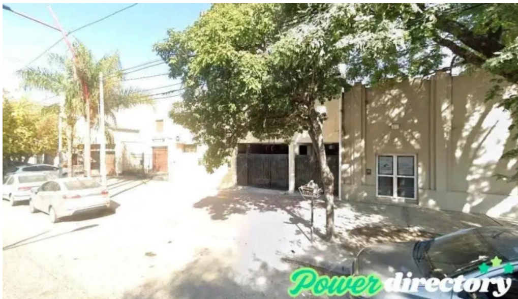
Estero credits santiago del estero