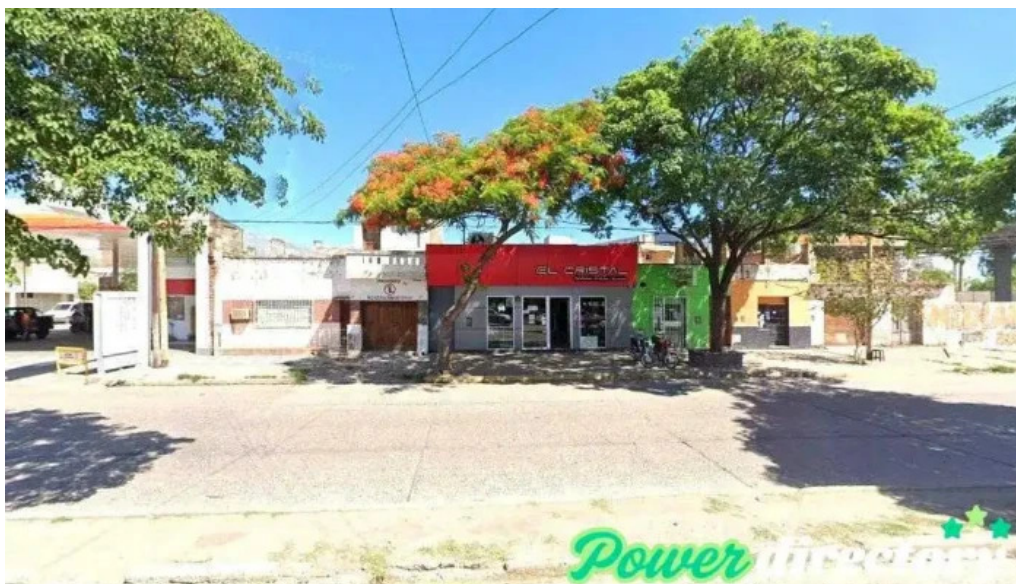
Credil santiago del estero