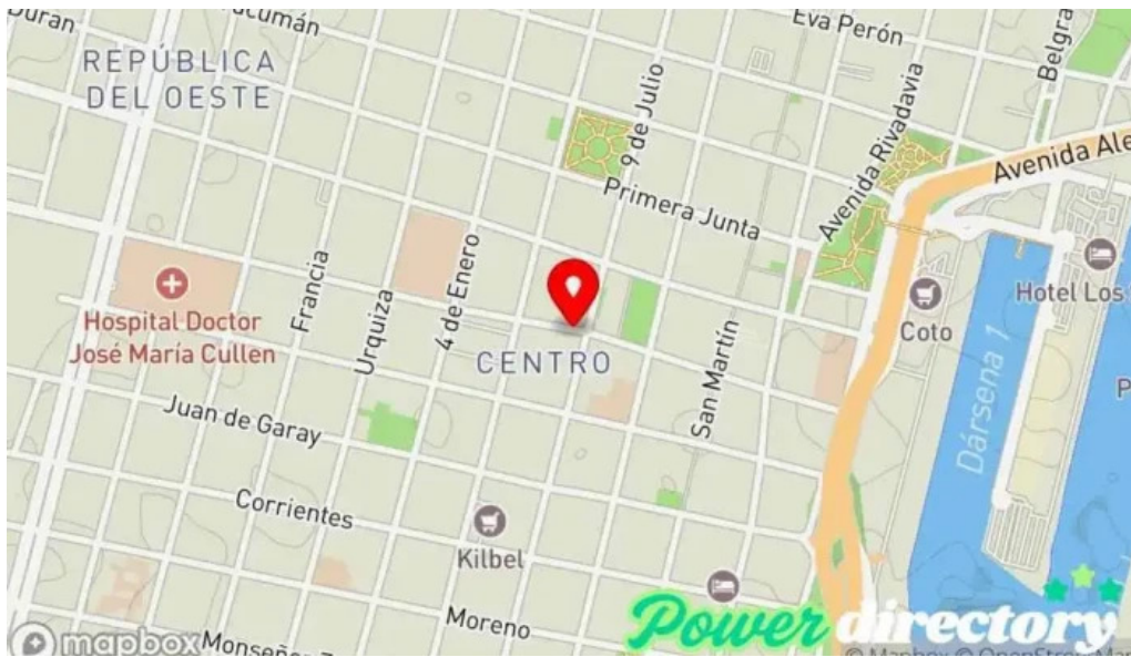
Silvercred prestamos personales mapa