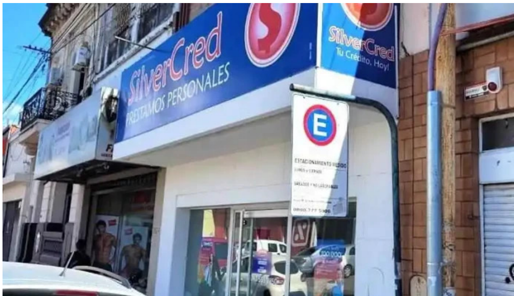
Silvercred prestamos personales santa fe de la vera cruz