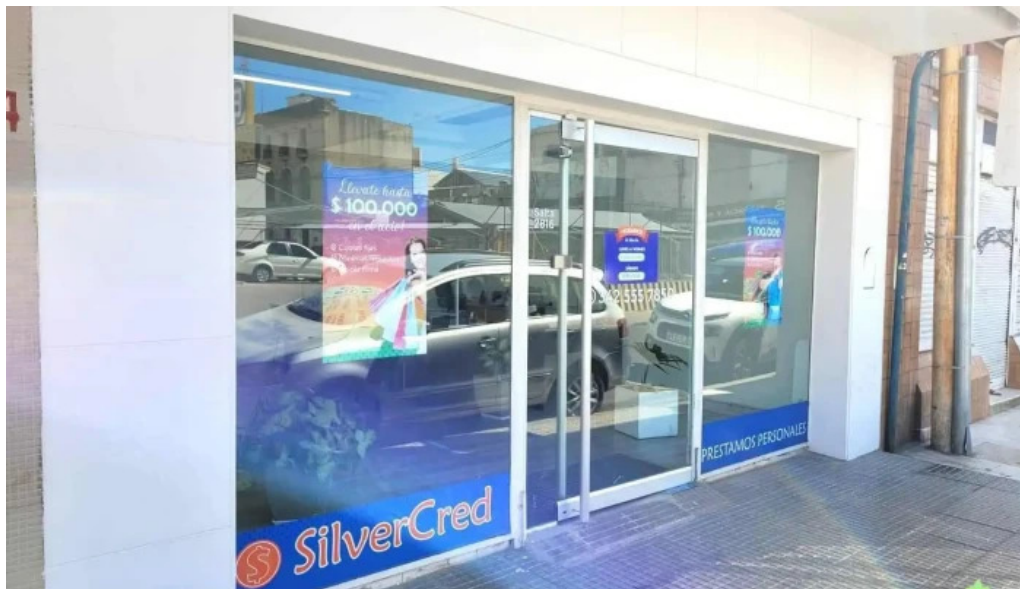
Silvercred prestamos personales exterior