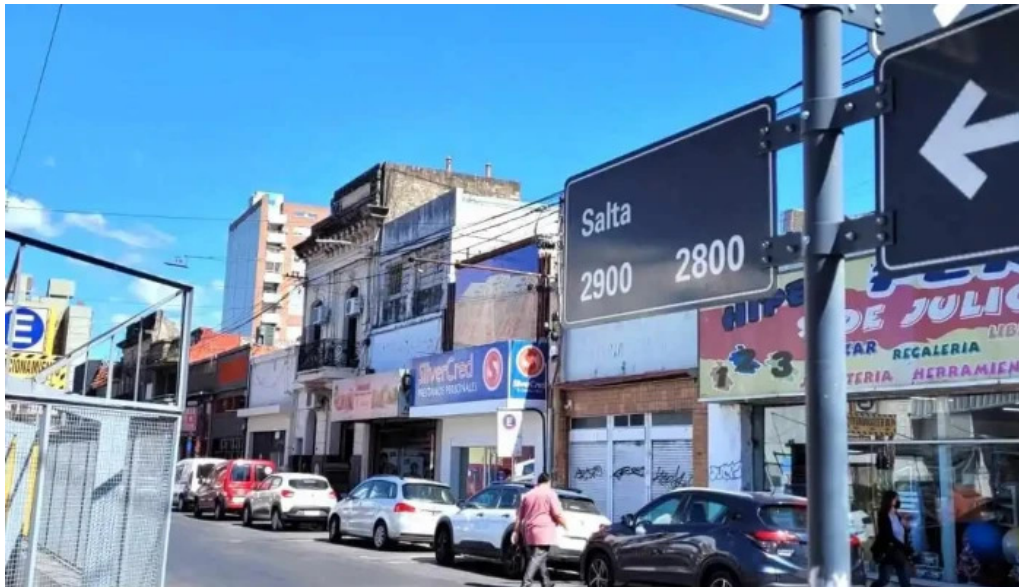
Silvercred prestamos personales del propietario