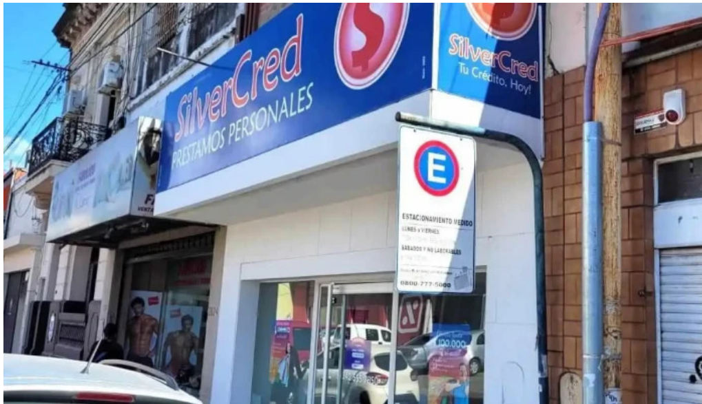
Silvercred prestamos personales ubicacion