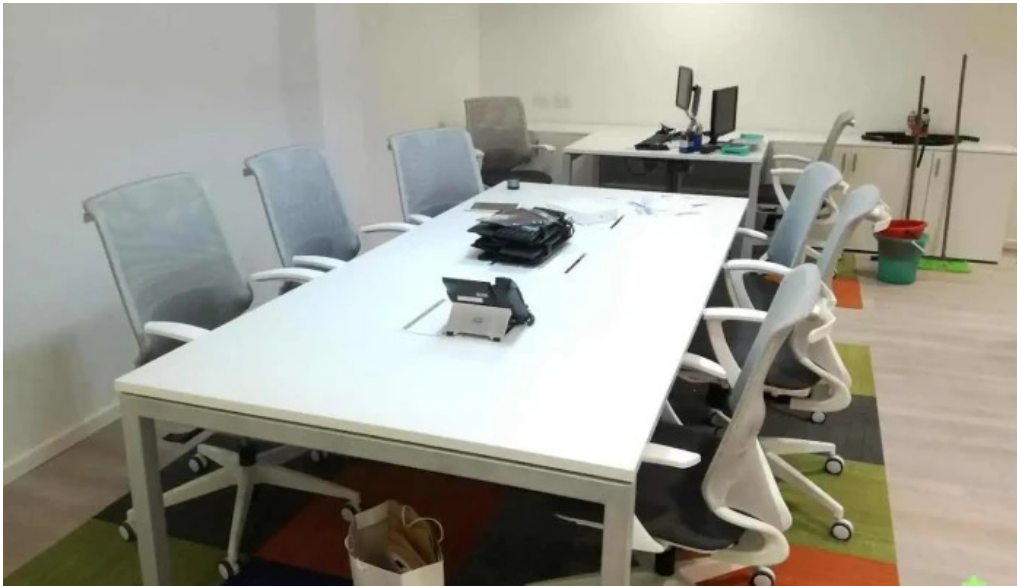
Garantizar santa fe de la vera cruz