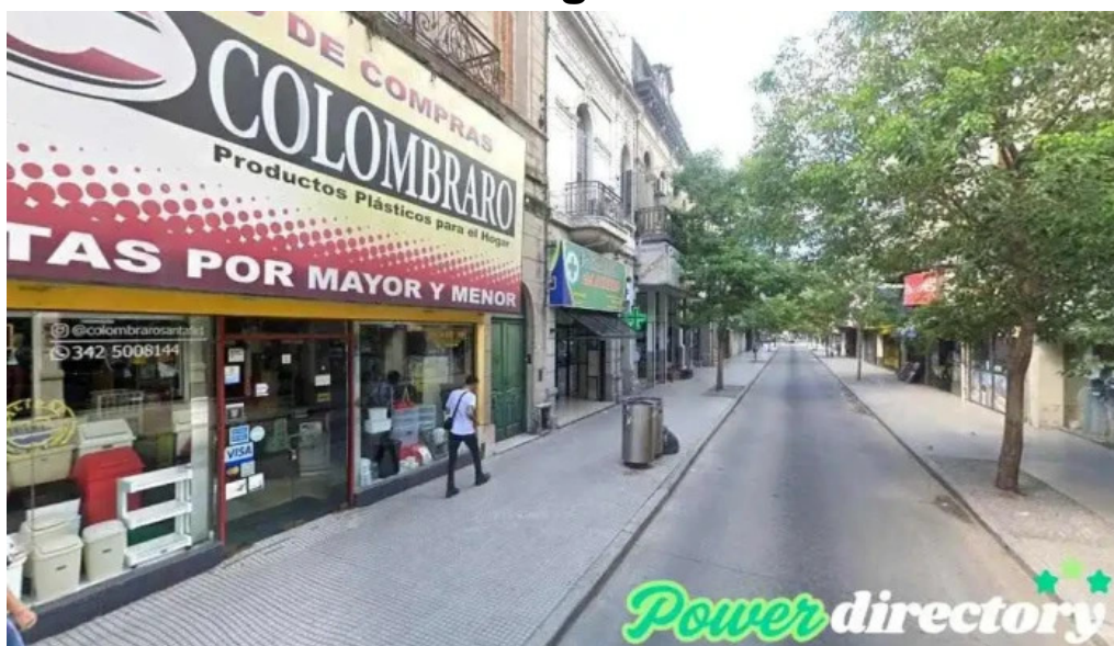
Credito argentino santa fe de la vera cruz