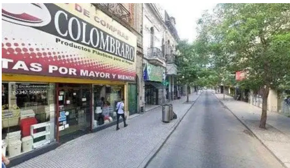
Credito argentino instagram