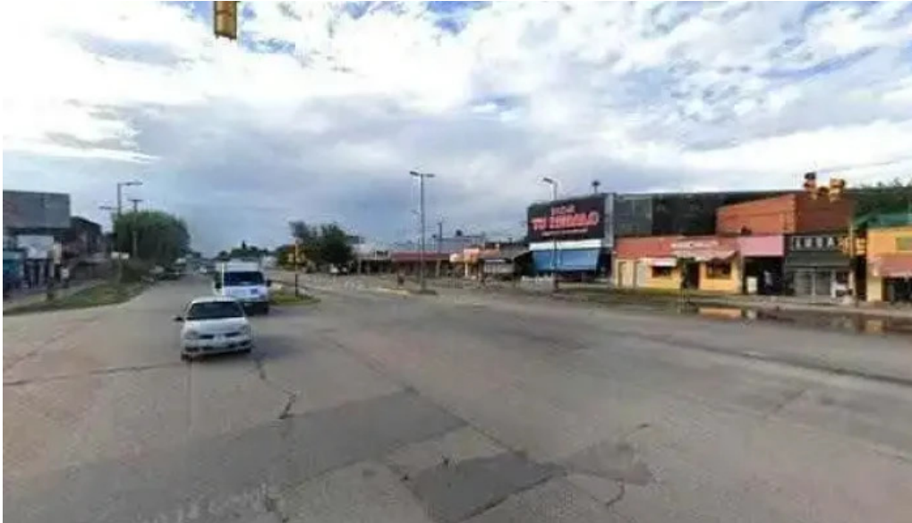
Credito argentino numero