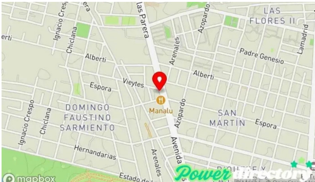
Credito argentino mapa