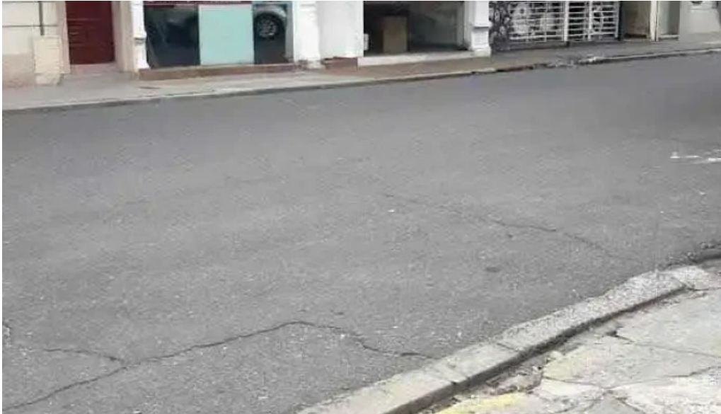
Credisen santa fe de la vera cruz