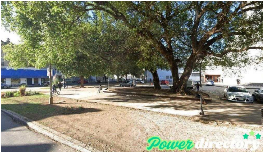
Credil prestamos en efectivo santa fe de la vera cruz