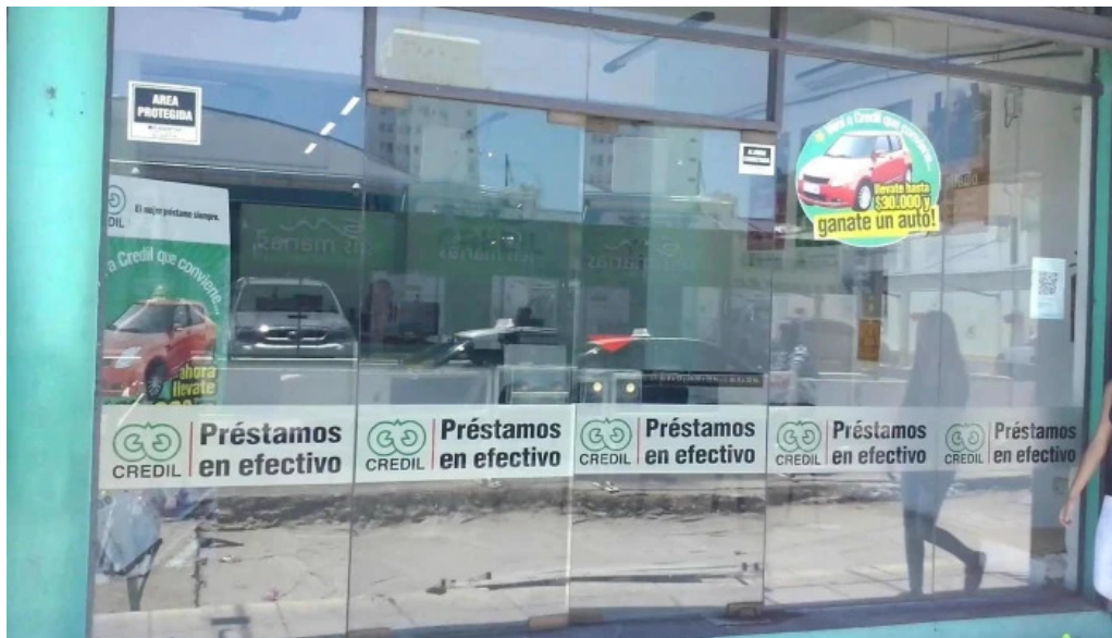
Credil prestamos en efectivo exterior