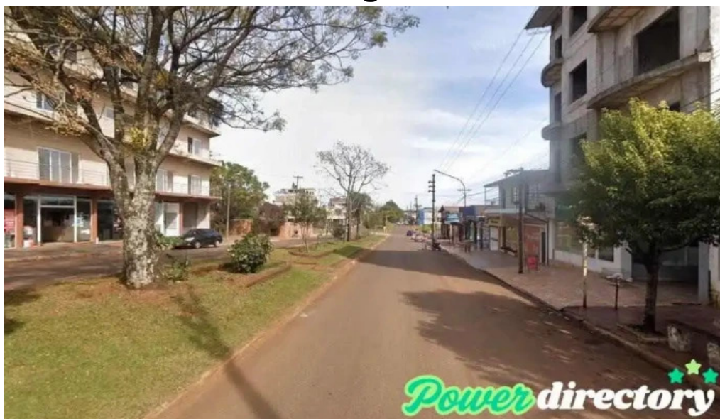
Credil prestamos en efectivo san vicente