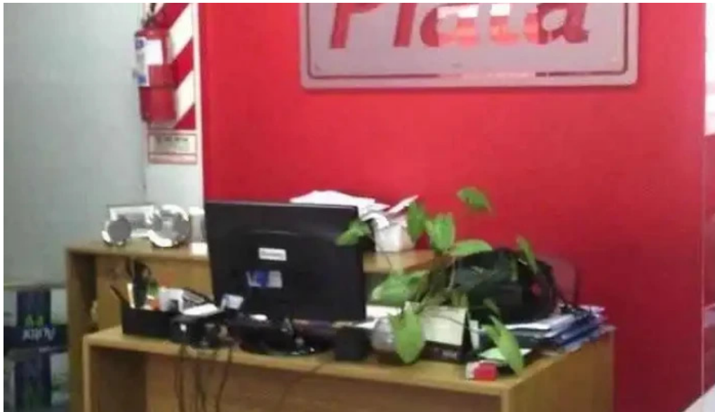
Tarjeta plata san salvador de jujuy