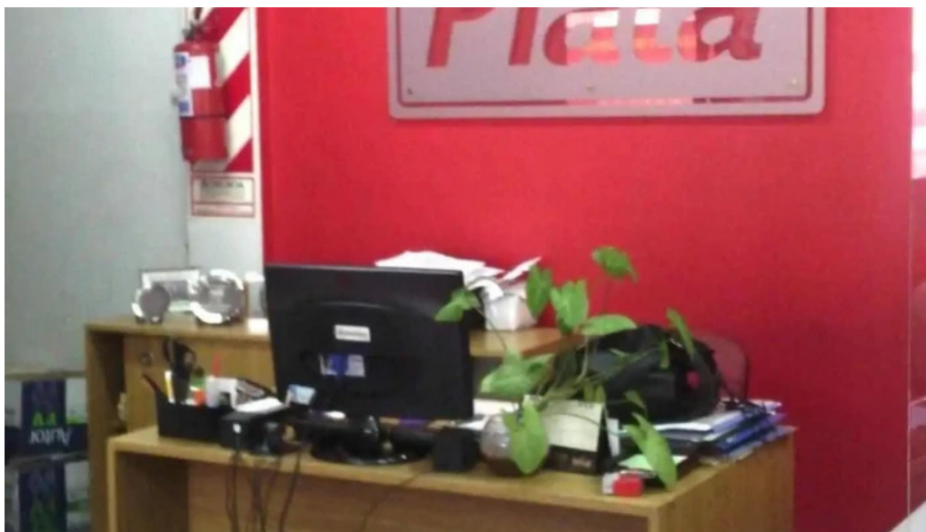
Tarjeta plata telefono