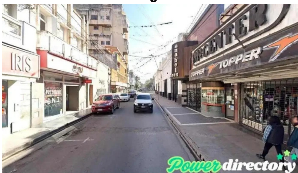
Tarjeta genial san salvador de jujuy