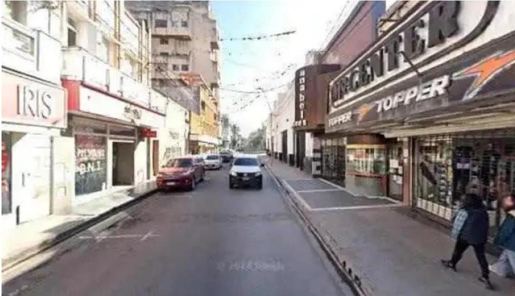
Tarjeta genial comentarios