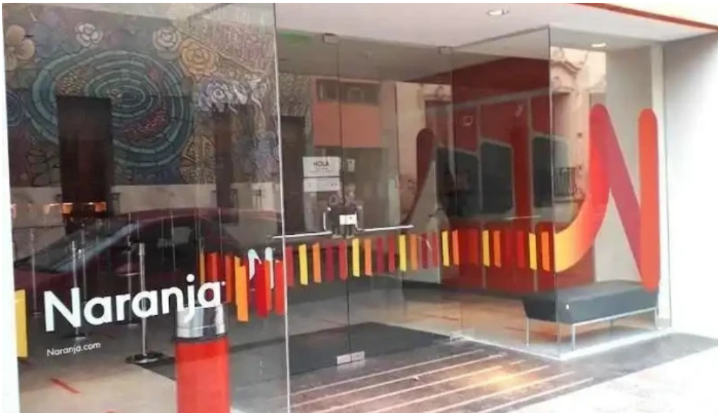
Naranja x jujuy san salvador de jujuy