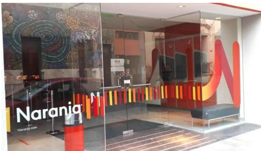
Naranja x jujuy como llegar