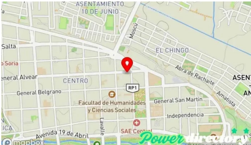
Naranja x jujuy mapa