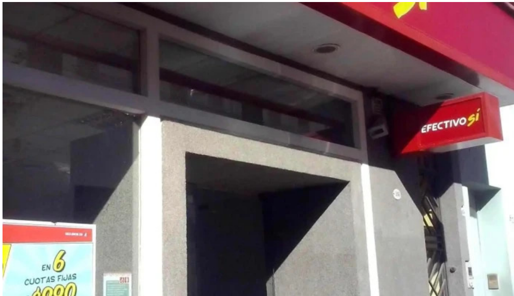
Efectivo si jujuy puntaje