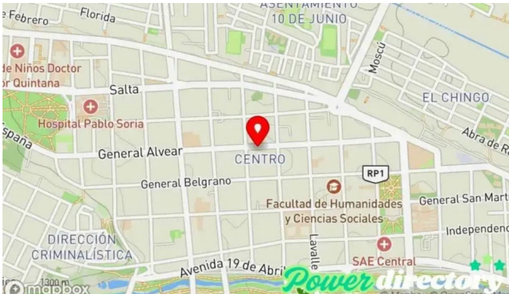
Efectivo si jujuy mapa