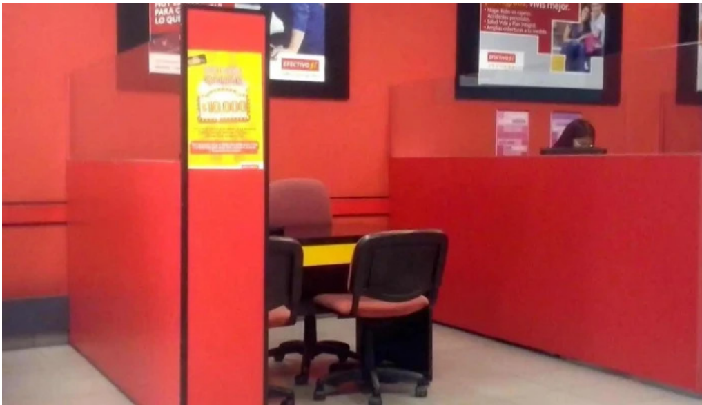
Efectivo si jujuy interior