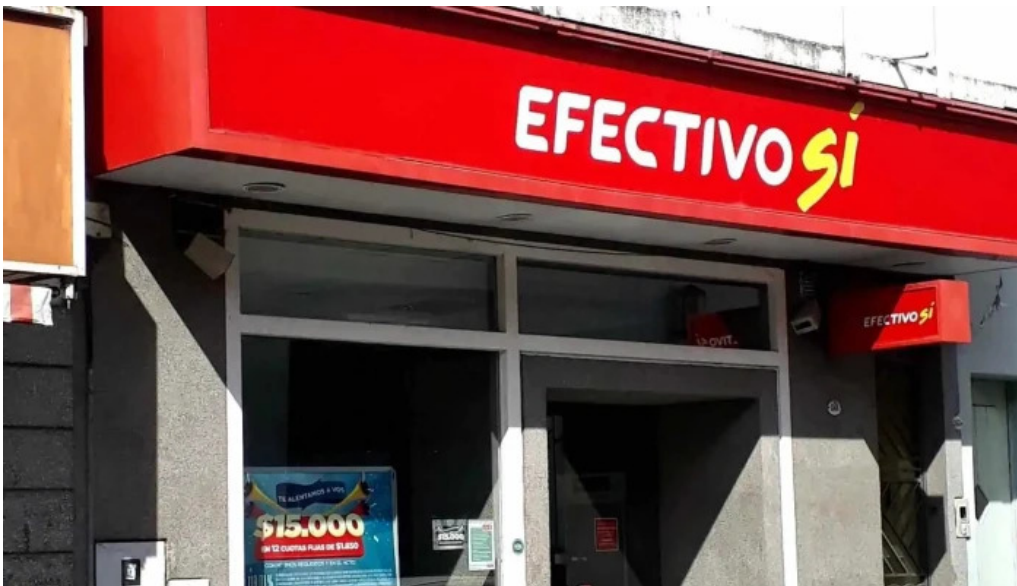
Efectivo si jujuy exterior