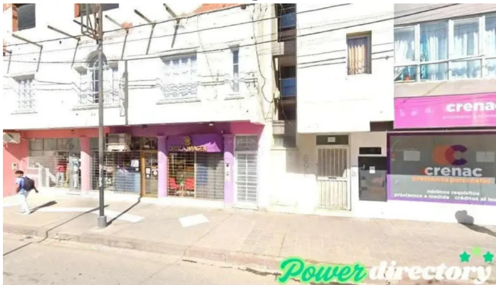
Crenac san salvador de jujuy