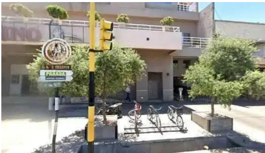
Multipres prestamos para institucion financieras horario