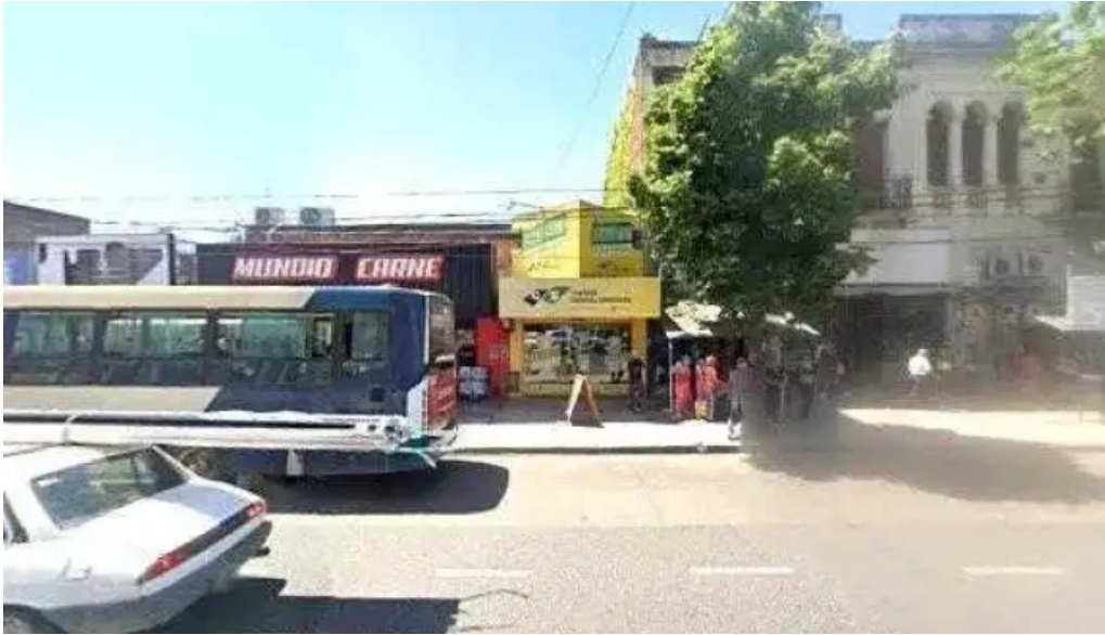
Credito general sarmiento opinionesdeg