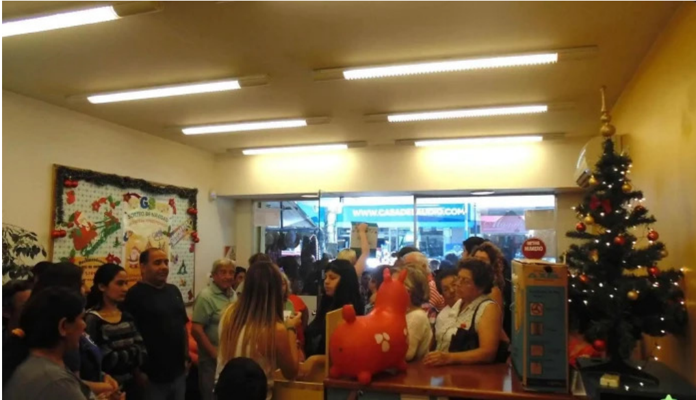
Credito general sarmiento del propietario