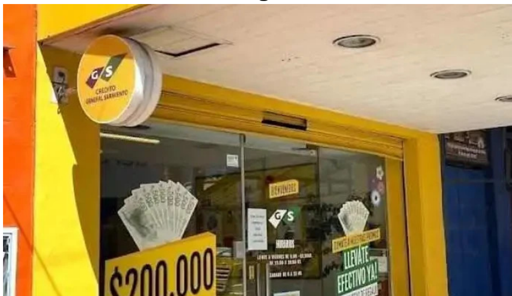
Credito general sarmiento san miguel