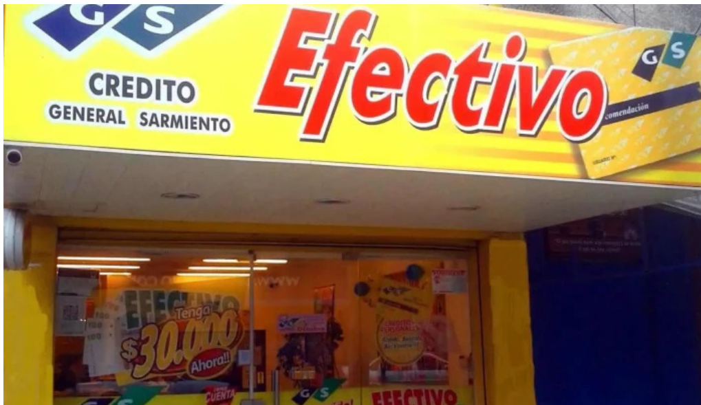
Credito general sarmiento exterior