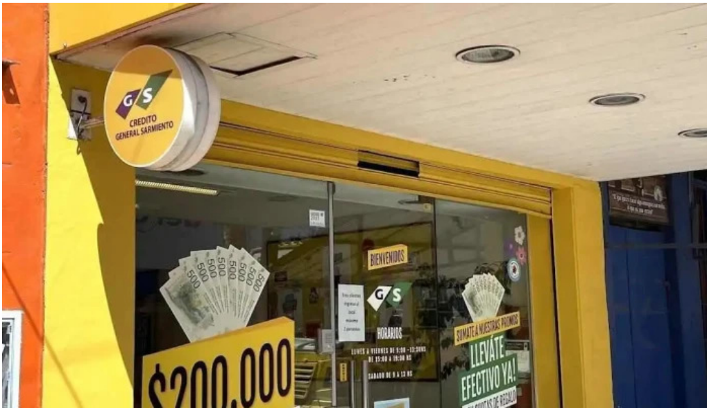
Credito general sarmiento opiniones