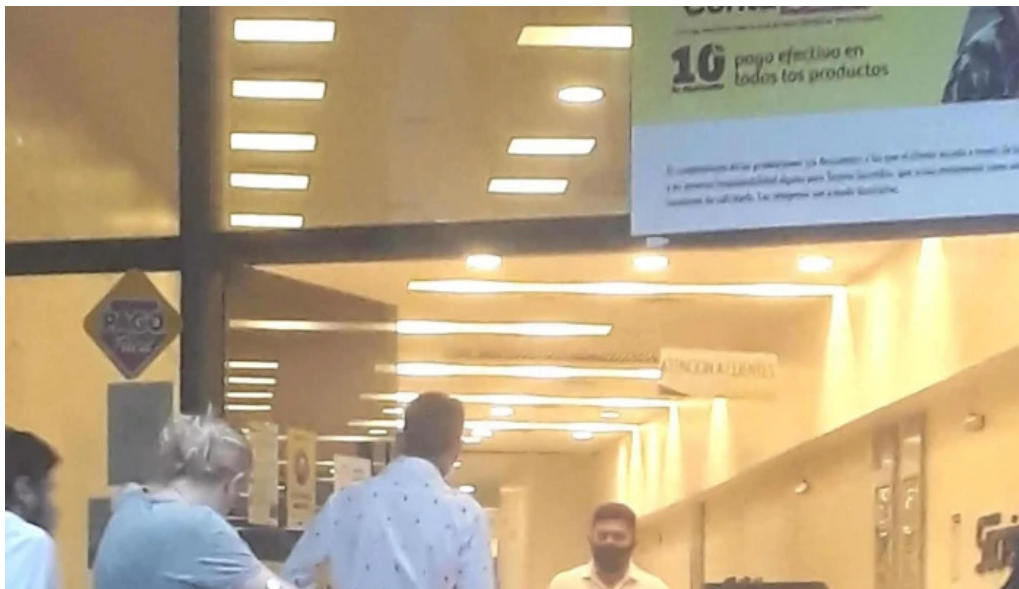
Tarjetasucredito san miguel de tucuman