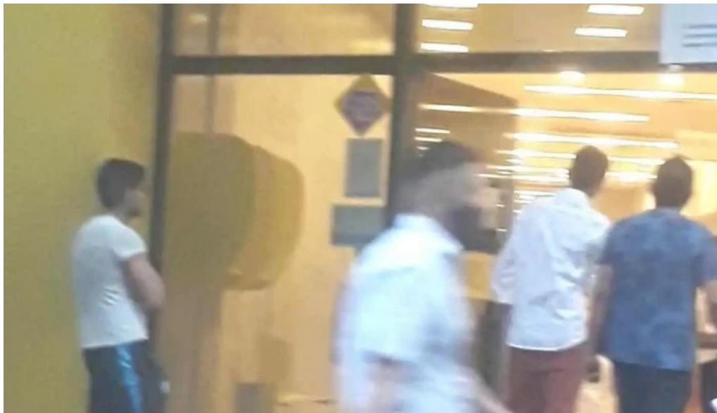
Tarjetasu credito videos