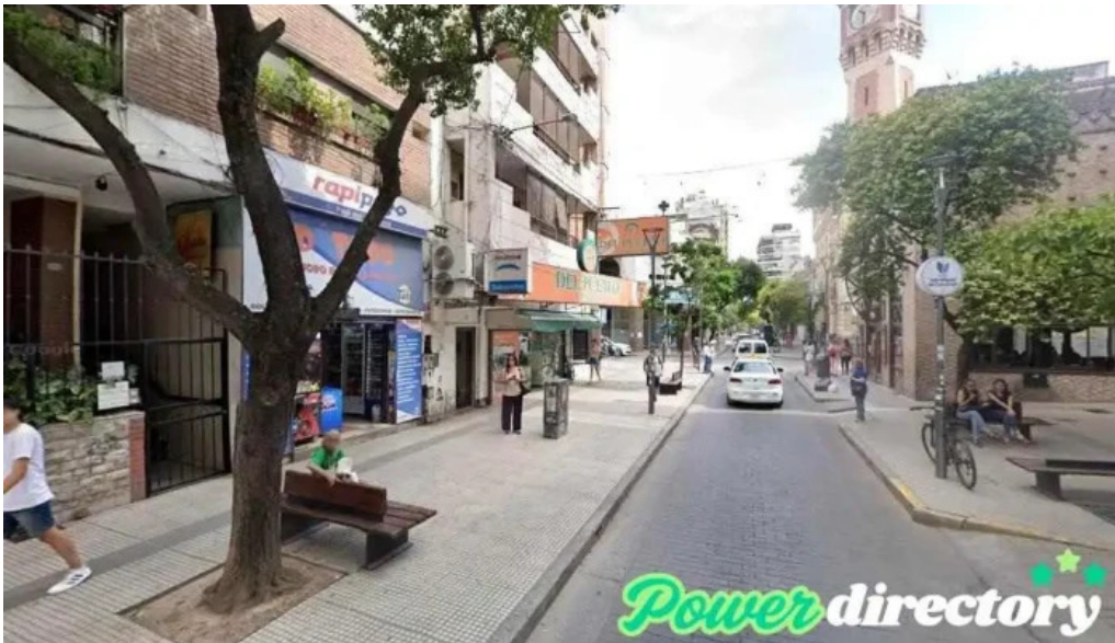
Tarjeta credicash san miguel de tucuman