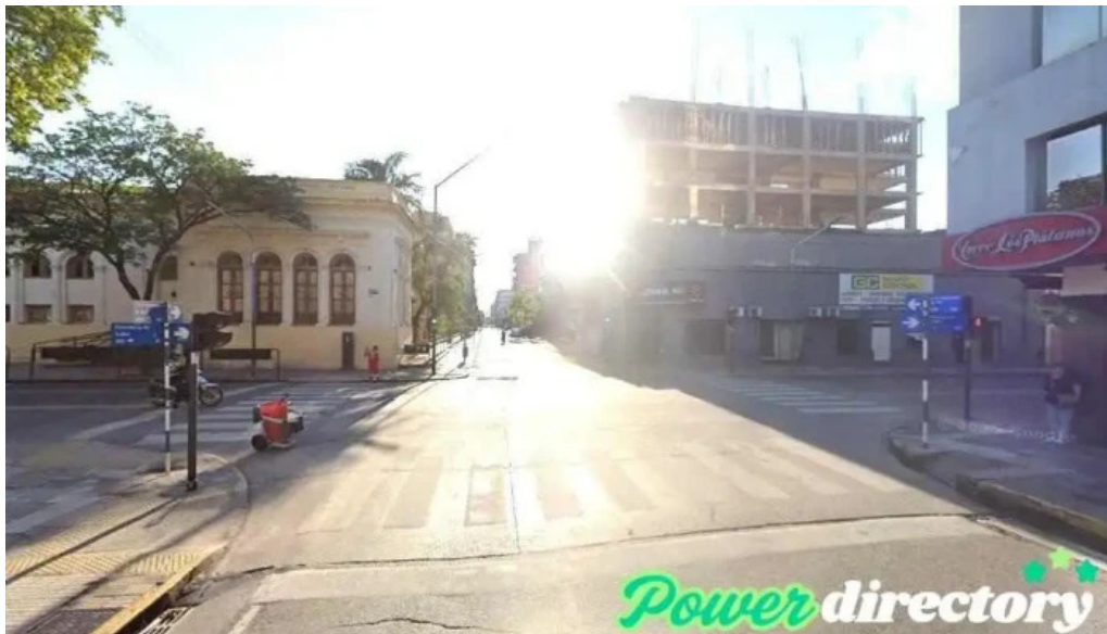
Rapicred tucuman san miguel de tucuman