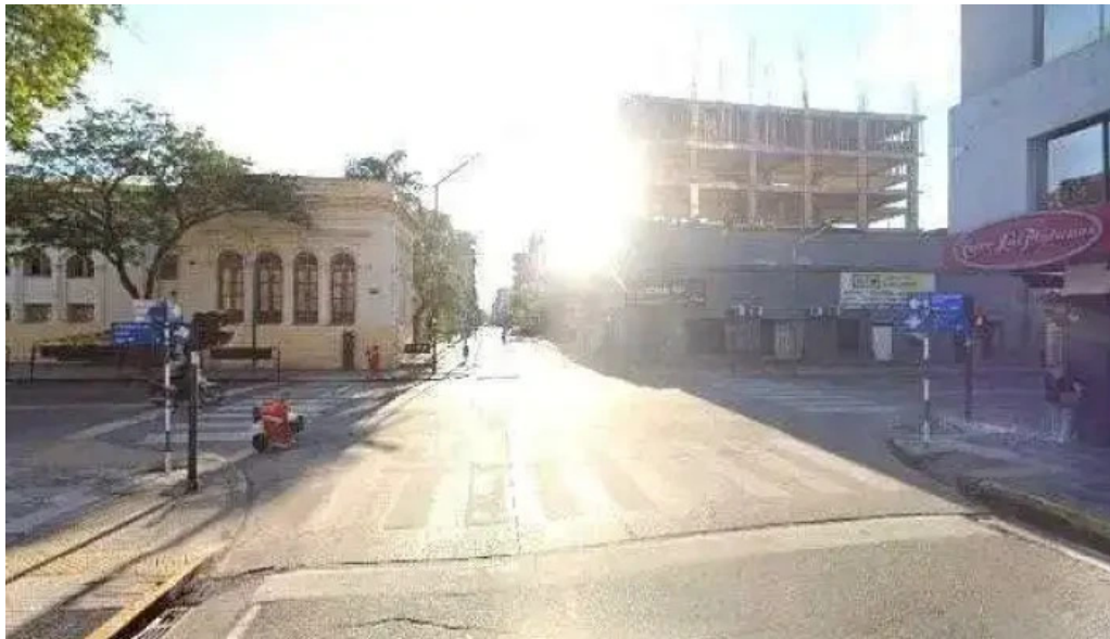
Rapicred tucuman instagram