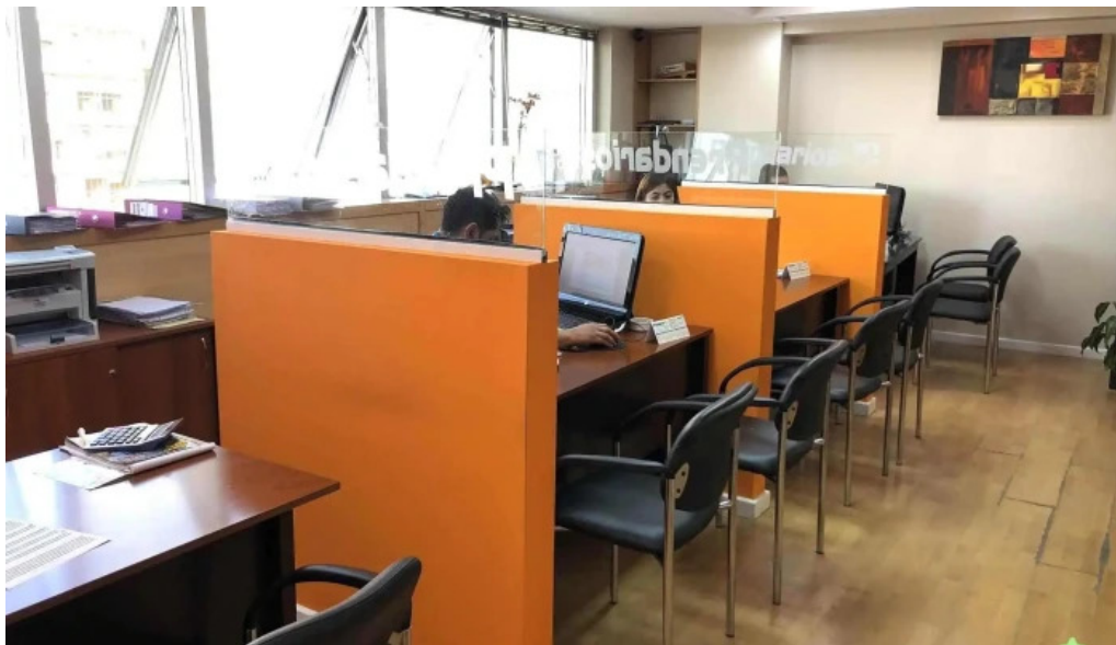
Prendarioscom financiacion de autos usados y 0km creditos uva y cuotas fijas del propietario