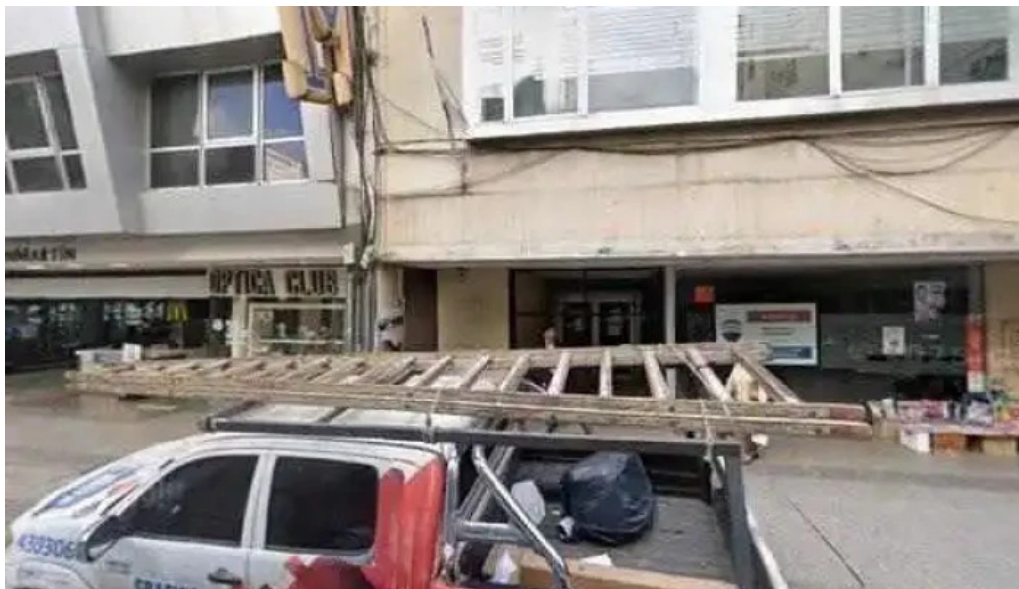
Prendarioscom financiacion de autos usados y 0km creditos uva y cuotas fijas dondedeg