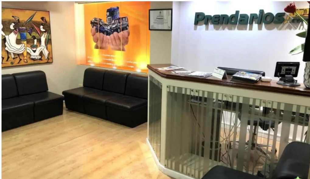
Prendarioscom financiacion de autos usados y 0km creditos uva y cuotas fijas interior