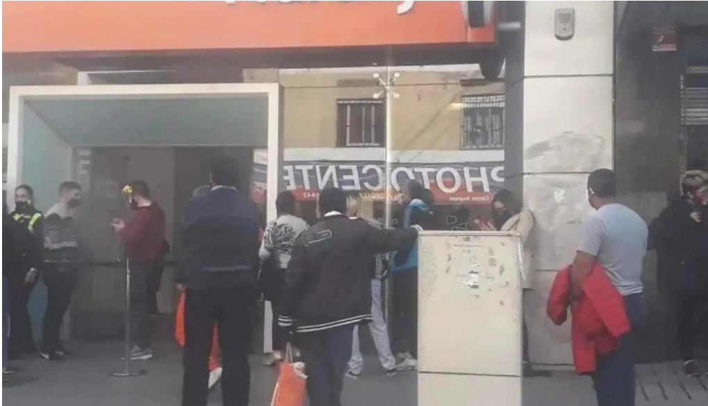
Naranja x tucuman exterior