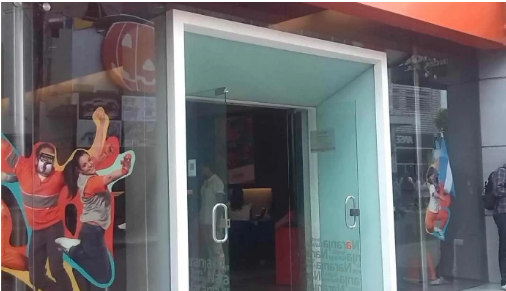
Naranja x tucuman comentarios