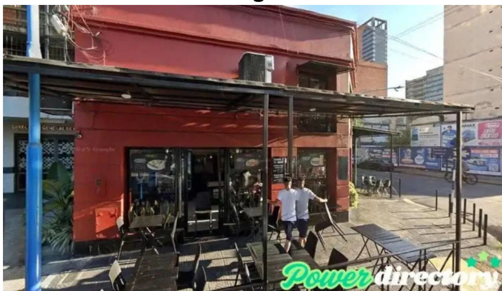
Garantizar san miguel de tucuman