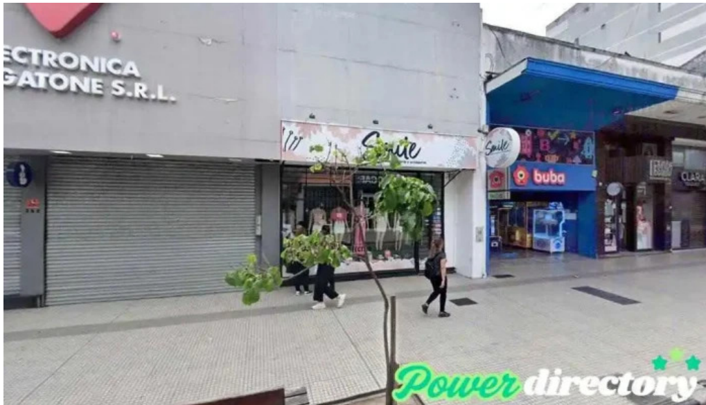
Credito argentino san miguel de tucuman