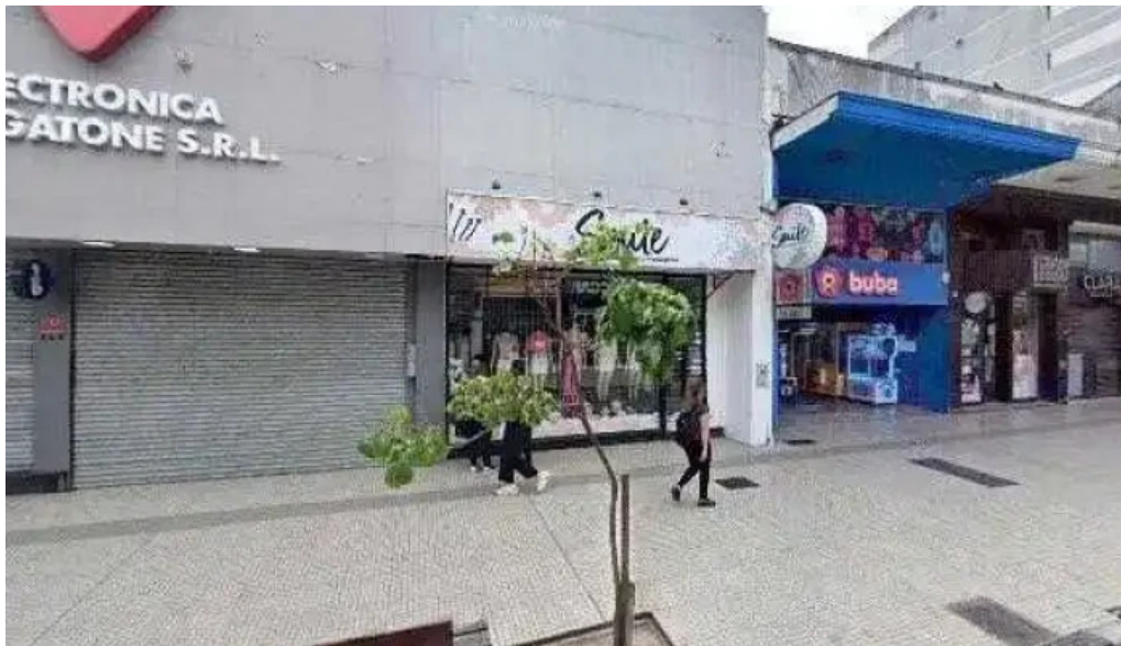
Credito argentino sitio web