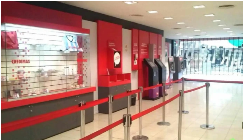
Credimas s a san miguel de tucuman