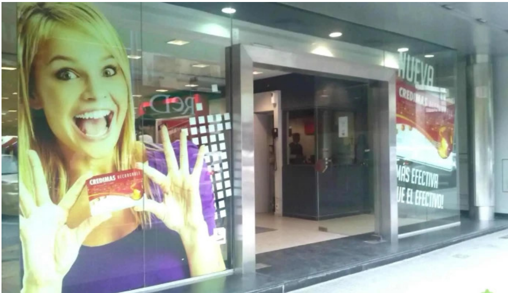
Credimas sa exterior