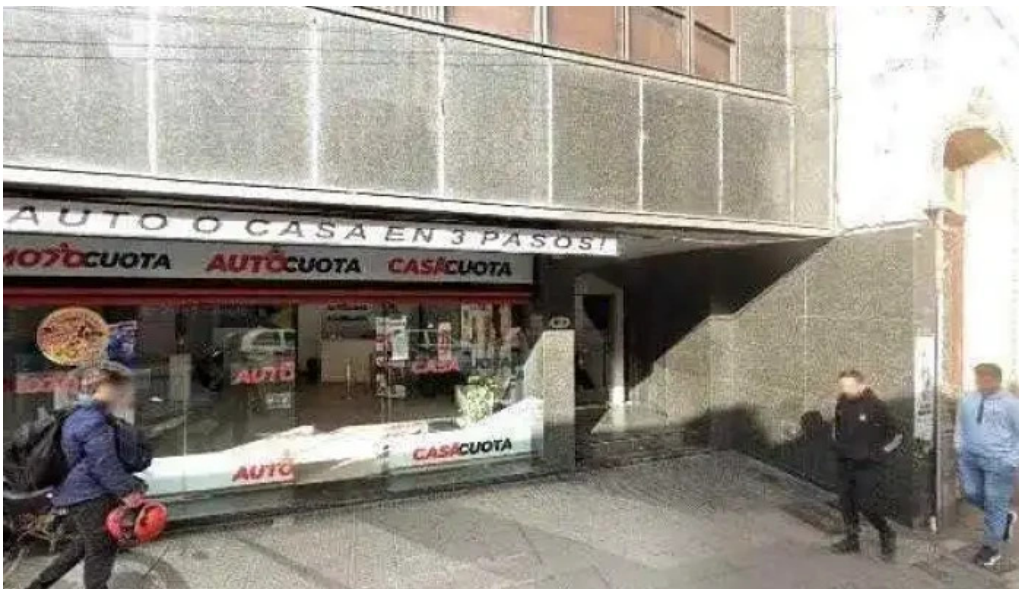
Credimas sa comentariosdeg