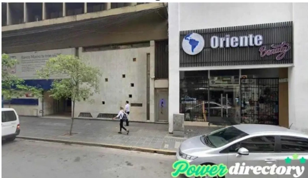
Credil san miguel de tucuman