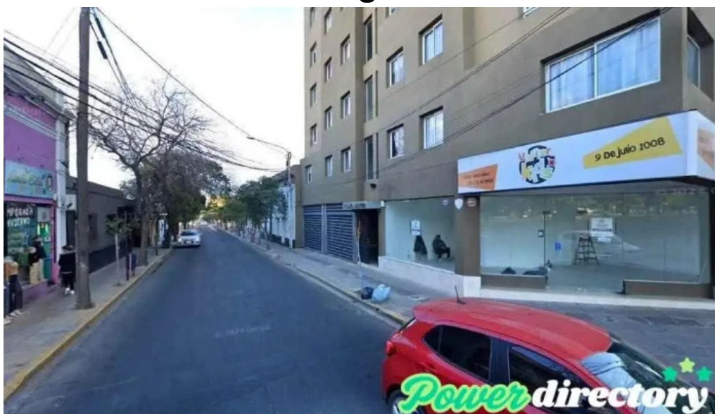
Credil prestamos en efectivo san luis