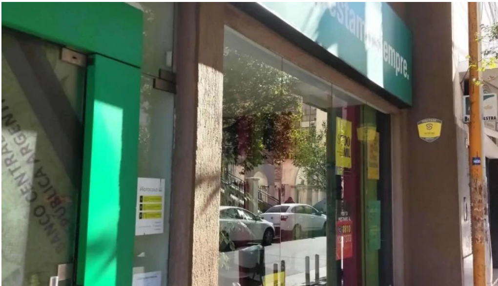
Credil prestamos en efectivo exterior