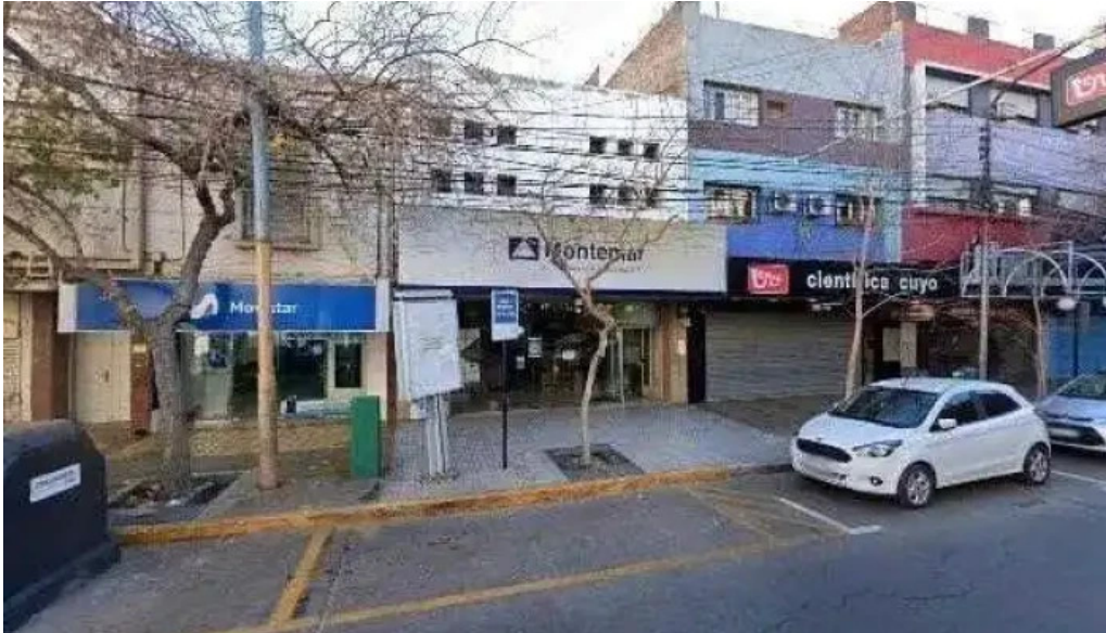
Montemar compania financiera sa horario