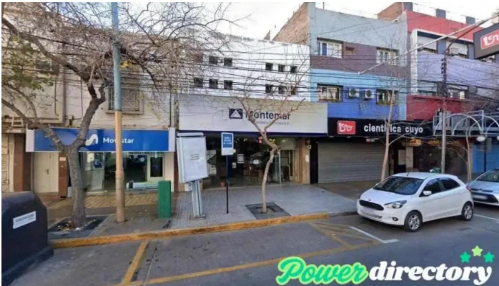
Montemar compania financiera s a san juan