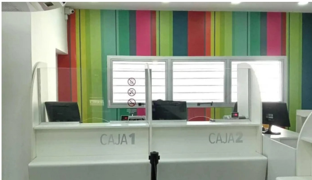
Credil prestamos en efectivo interior