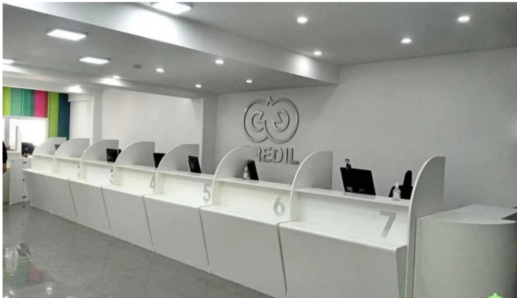
Credil prestamos en efectivo san juan