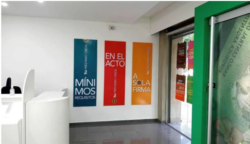
Credil prestamos en efectivo del propietario