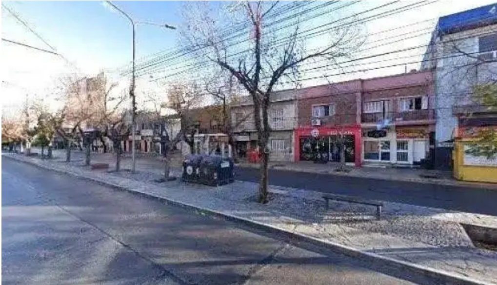
Credil prestamos en efectivo fotos