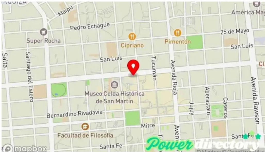
Credil prestamos en efectivo mapa