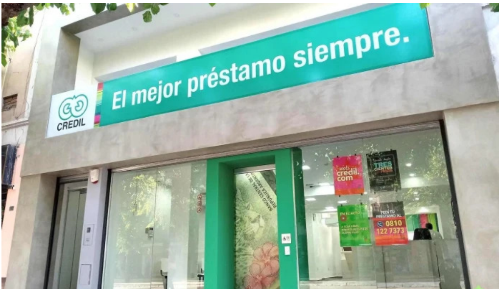
Credil prestamos en efectivo exterior