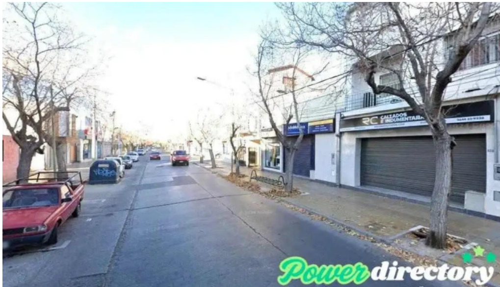
Coordinar prestamos personales san juan