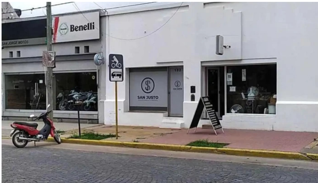
San justo soluciones del propietario