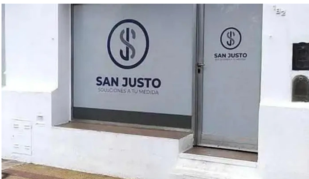
San justo soluciones san francisco