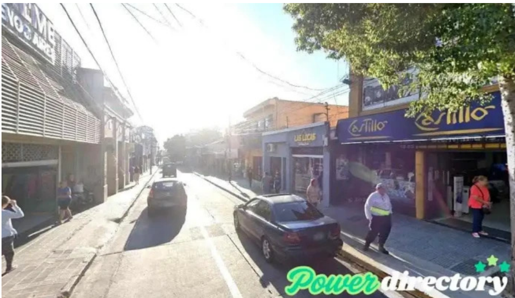
Tarjeta credi cash san fernando del valle de catamarca