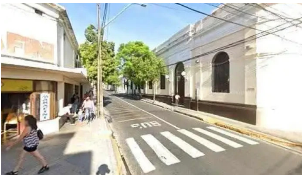
Global credits puntaje