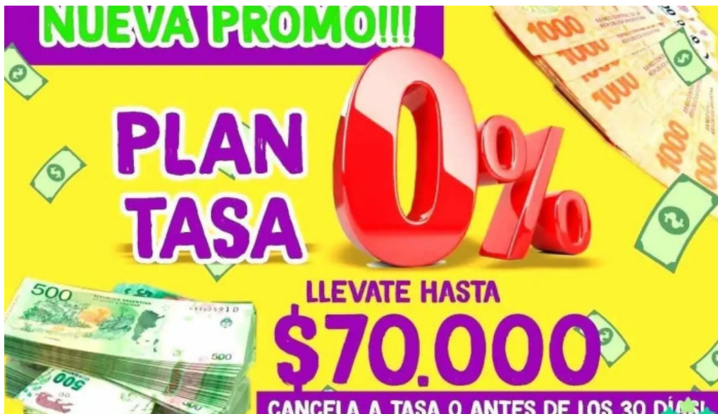
Global credits del propietario