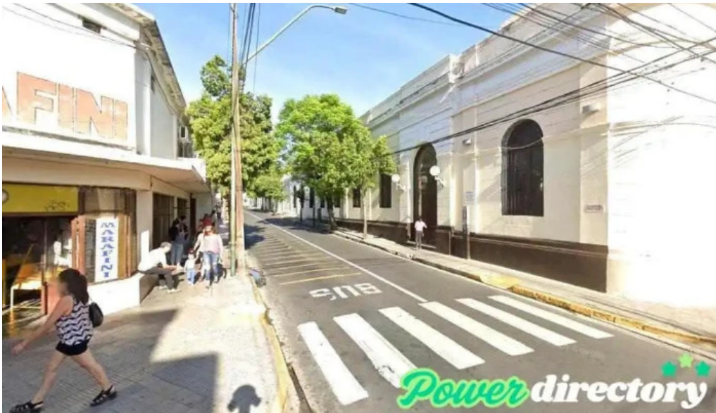
Global credits san fernando del valle de catamarca