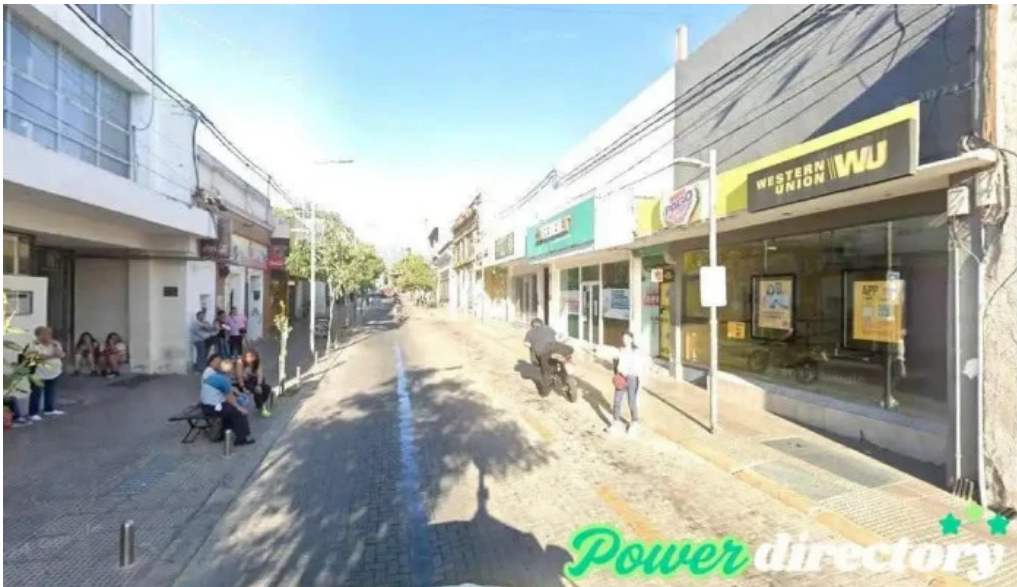
Credito argentino san fernando del valle de catamarca