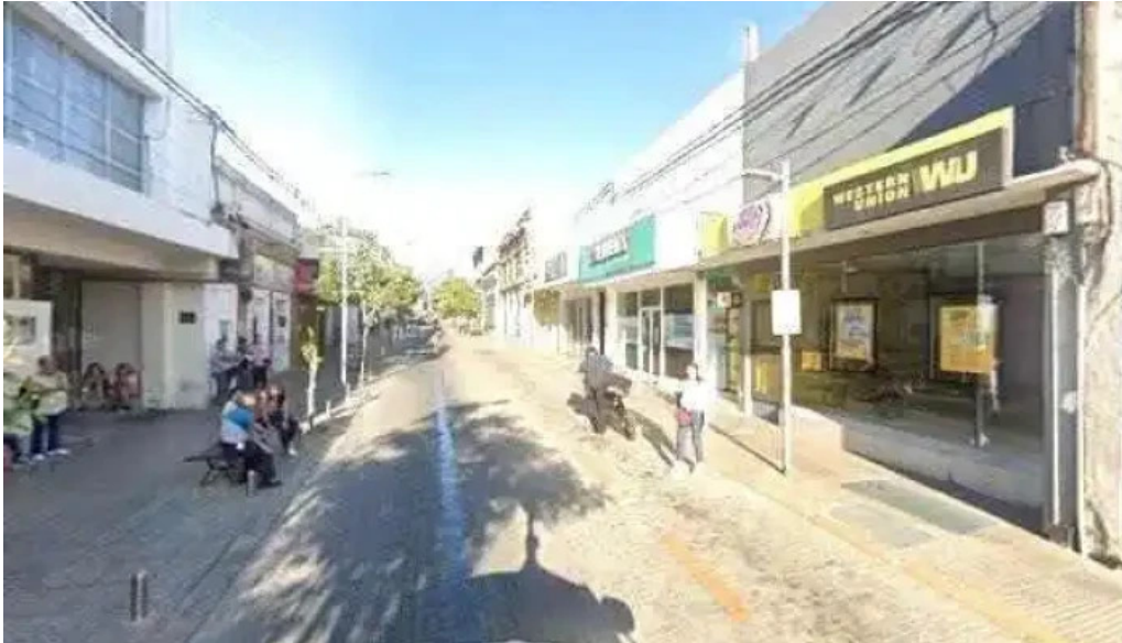
Credito argentino cerca de mi