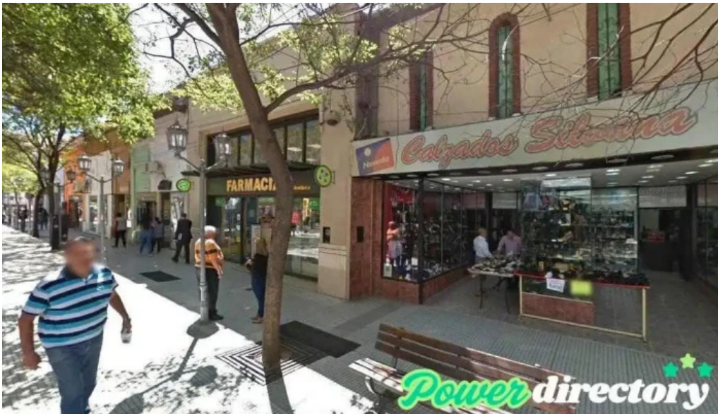
Crediar sa san fernando del valle de catamarca