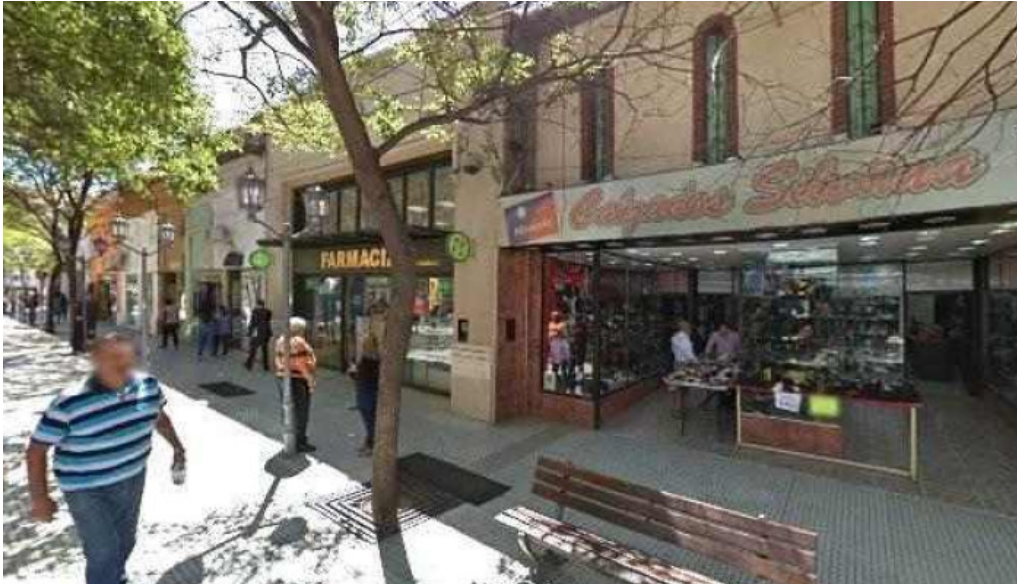
Crediar sa cerca de mi