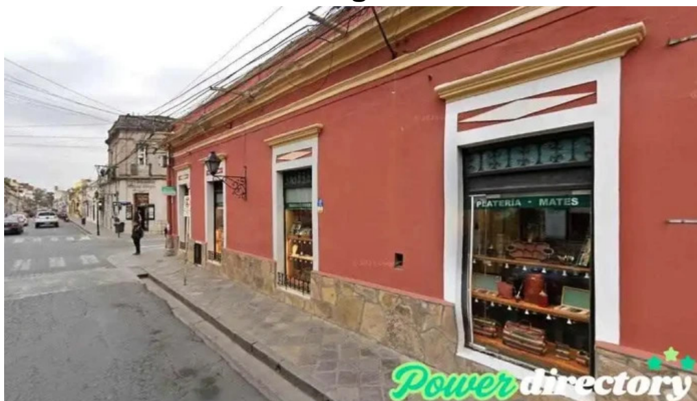
Préstamo amigo salta