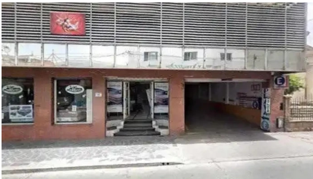
Dinero full como llegar