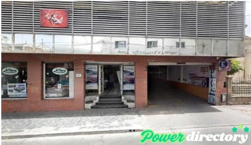
Dinero full salta