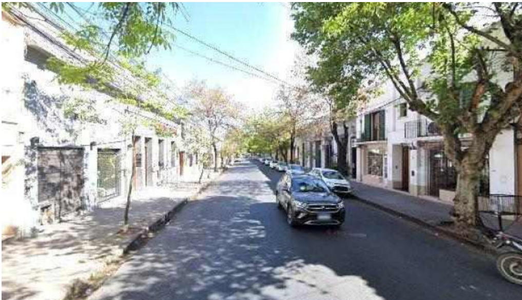
Credil prestamos en efectivo ubicacion