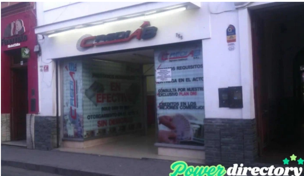
Credi ab comentarios