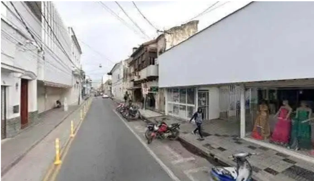
Credi ab comentariosdeg