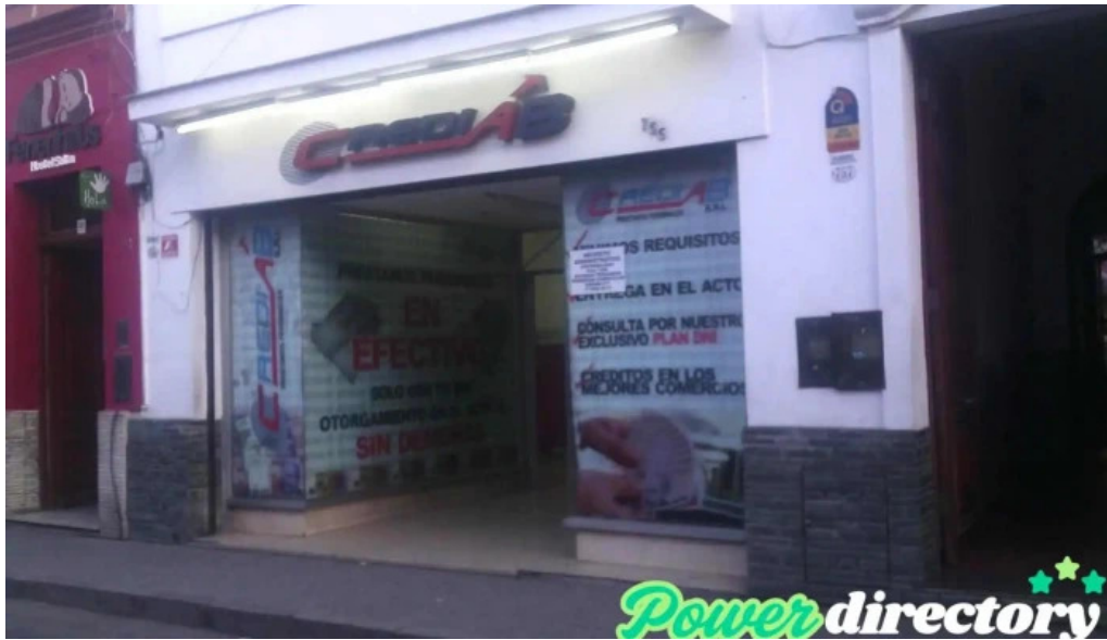
Credi ab salta