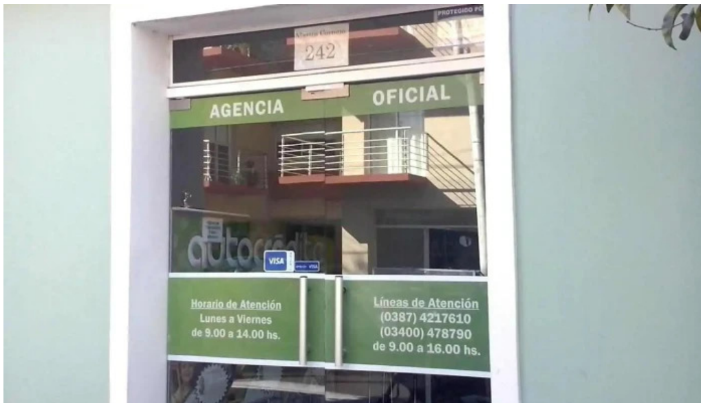
Autocredito agencia oficial salta ubicacion