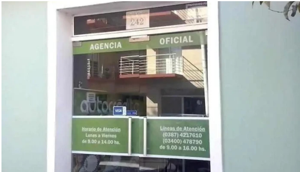
Autocredito agencia oficial salta salta