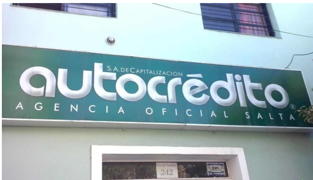
Autocredito agencia oficial salta exterior