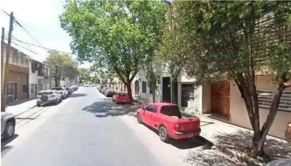
Autocredito agencia oficial salta ubicaciondeg