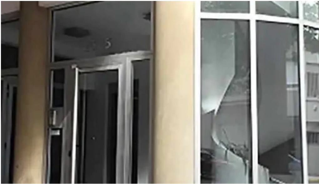
Decreditos rosario mas recientes