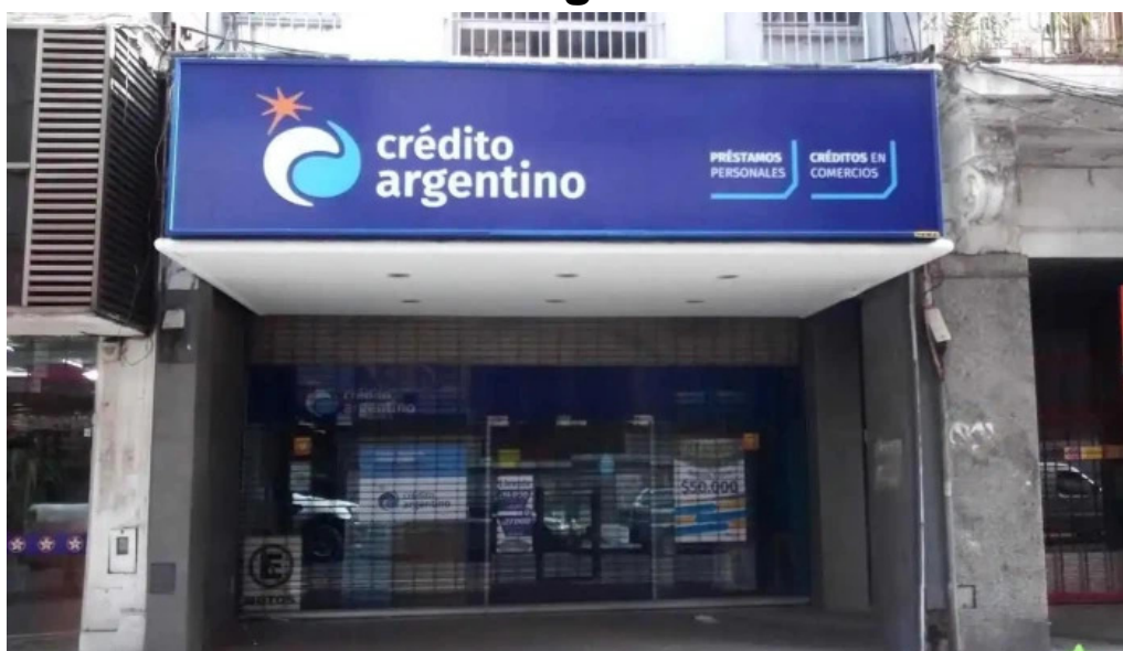
Credito argentino rosario