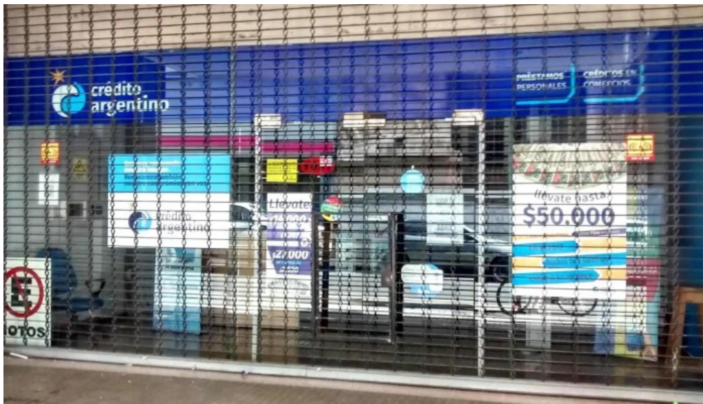
Credito argentino exterior