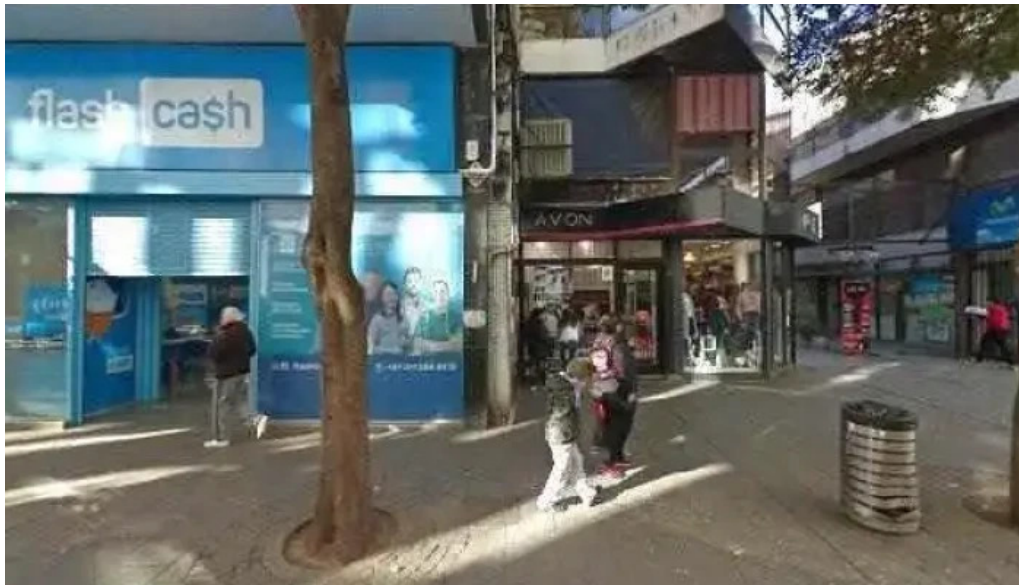
Credito argentino fotos