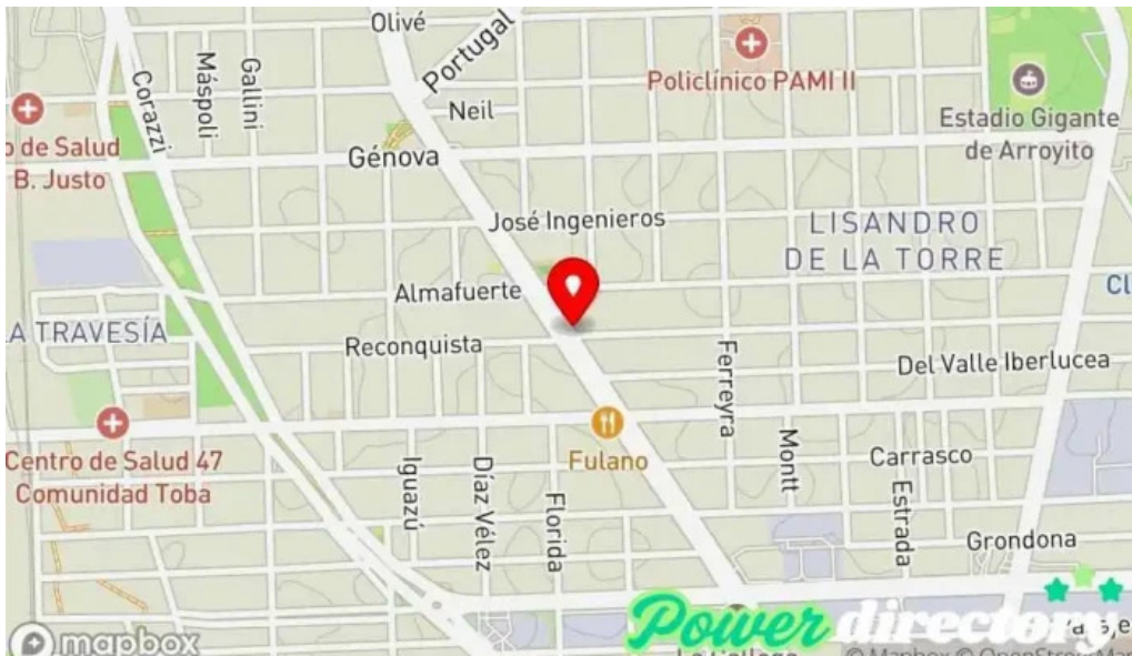
Credito argentino mapa