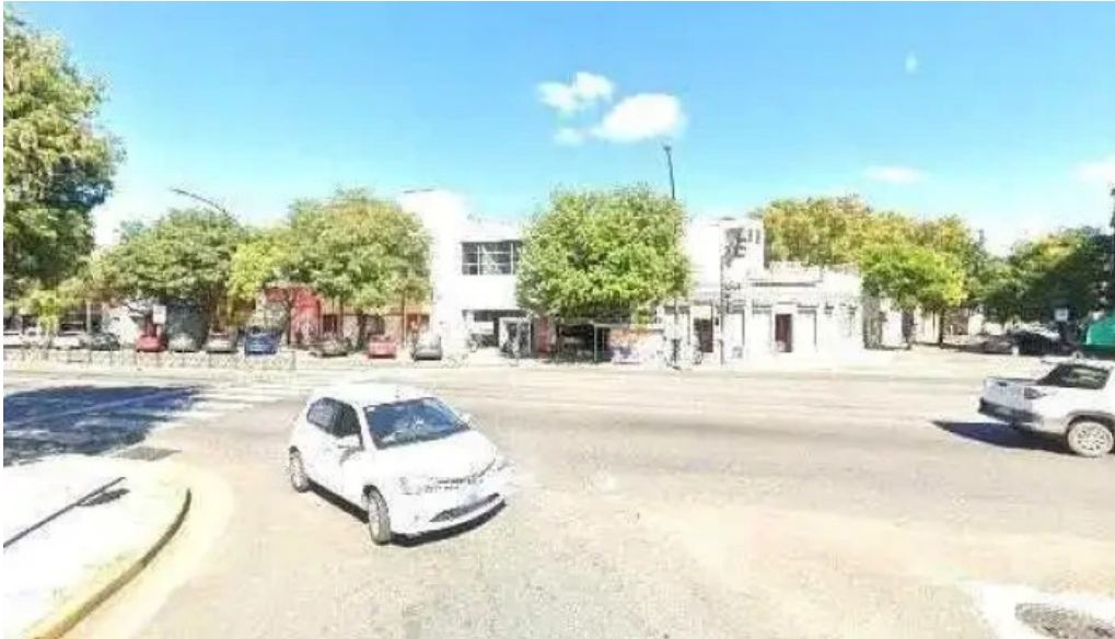
Credito argentino promocion