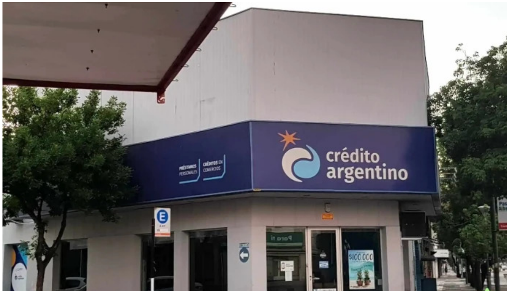
Credito argentino exterior