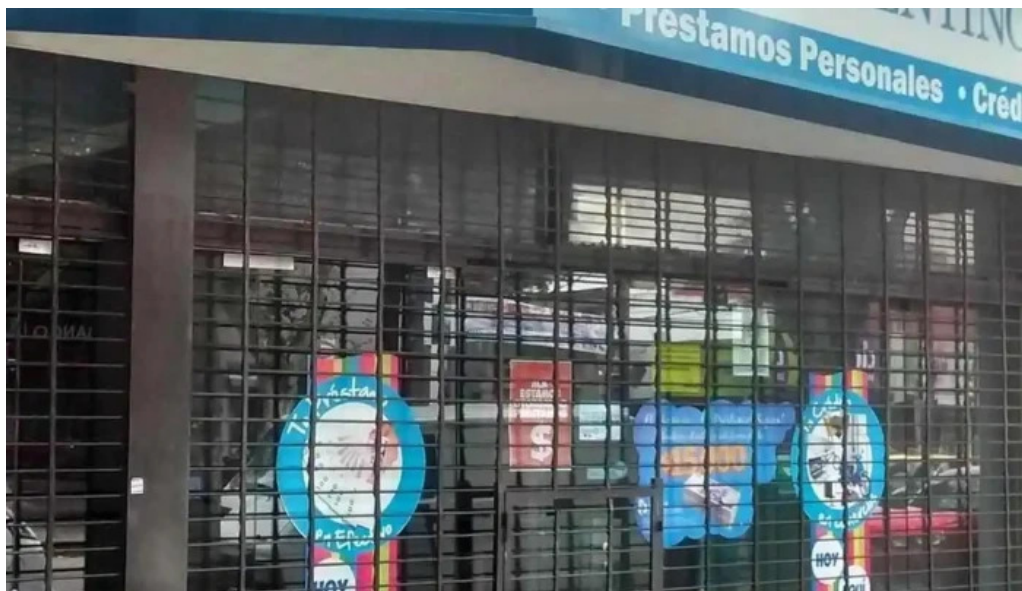
Credito argentino exterior