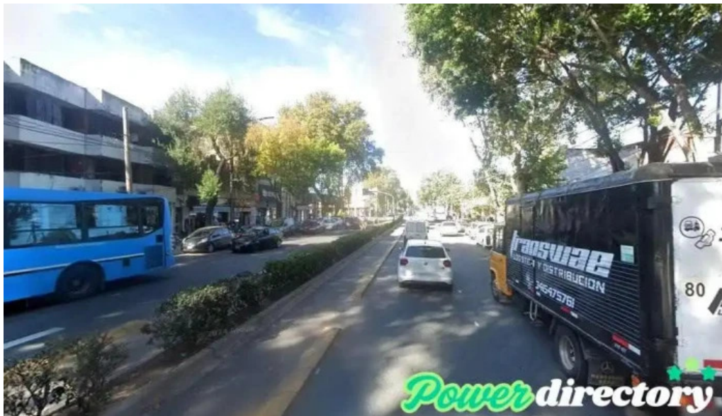
Credito argentino rosario