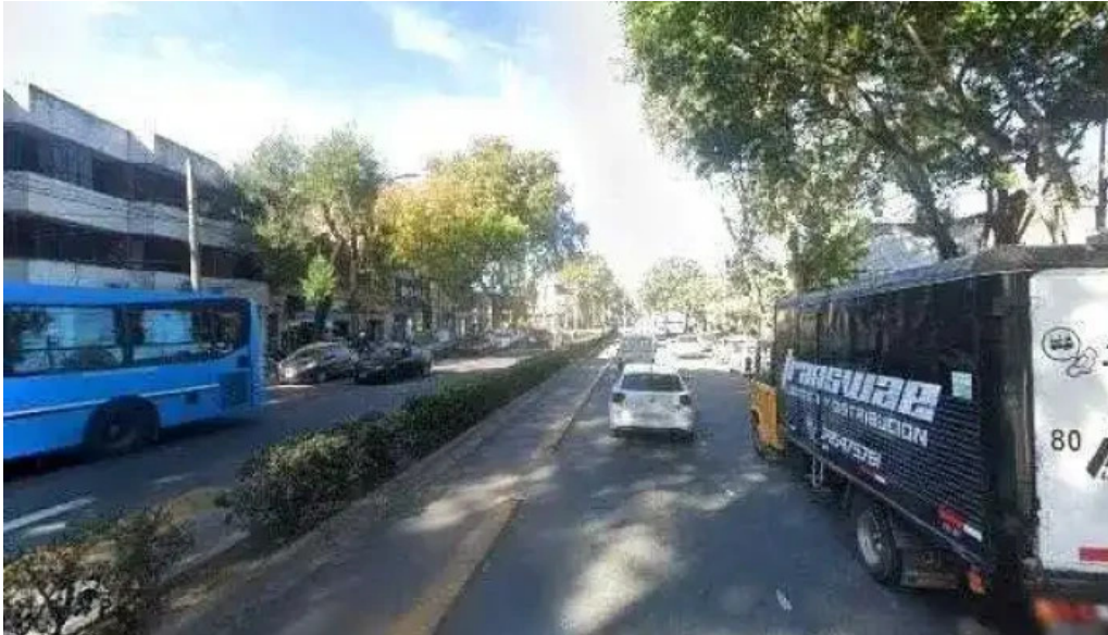
Credito argentino descuentos