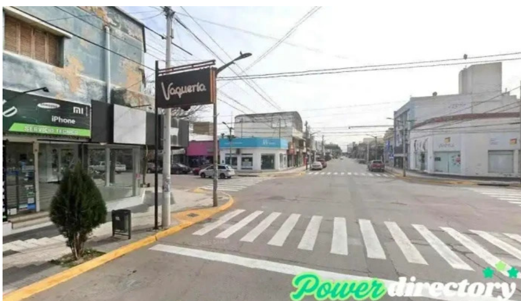
Credito argentino rio tercero