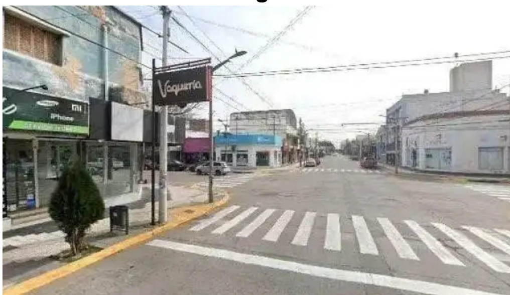
Credito argentino videos