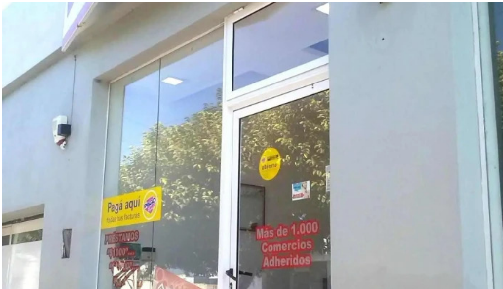
Pase libre exterior