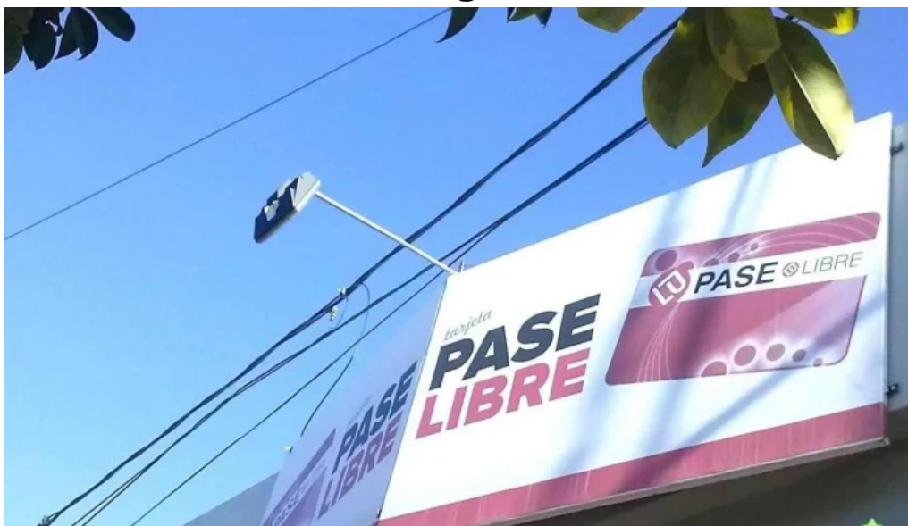
Pase libre rio segundo