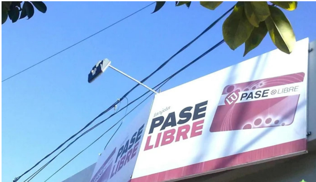
Pase libre puntaje