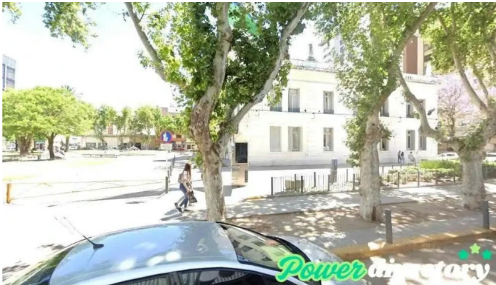
Credito argentino rio cuarto