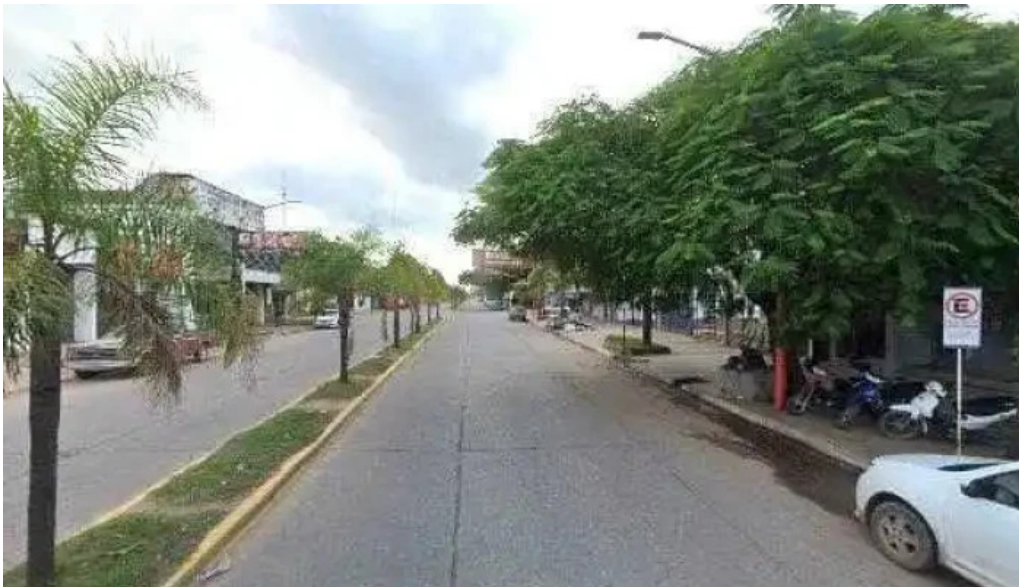
Nuevo banco del chaco sa videos