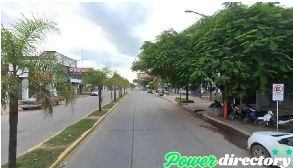
Nuevo banco del chaco s a resistencia